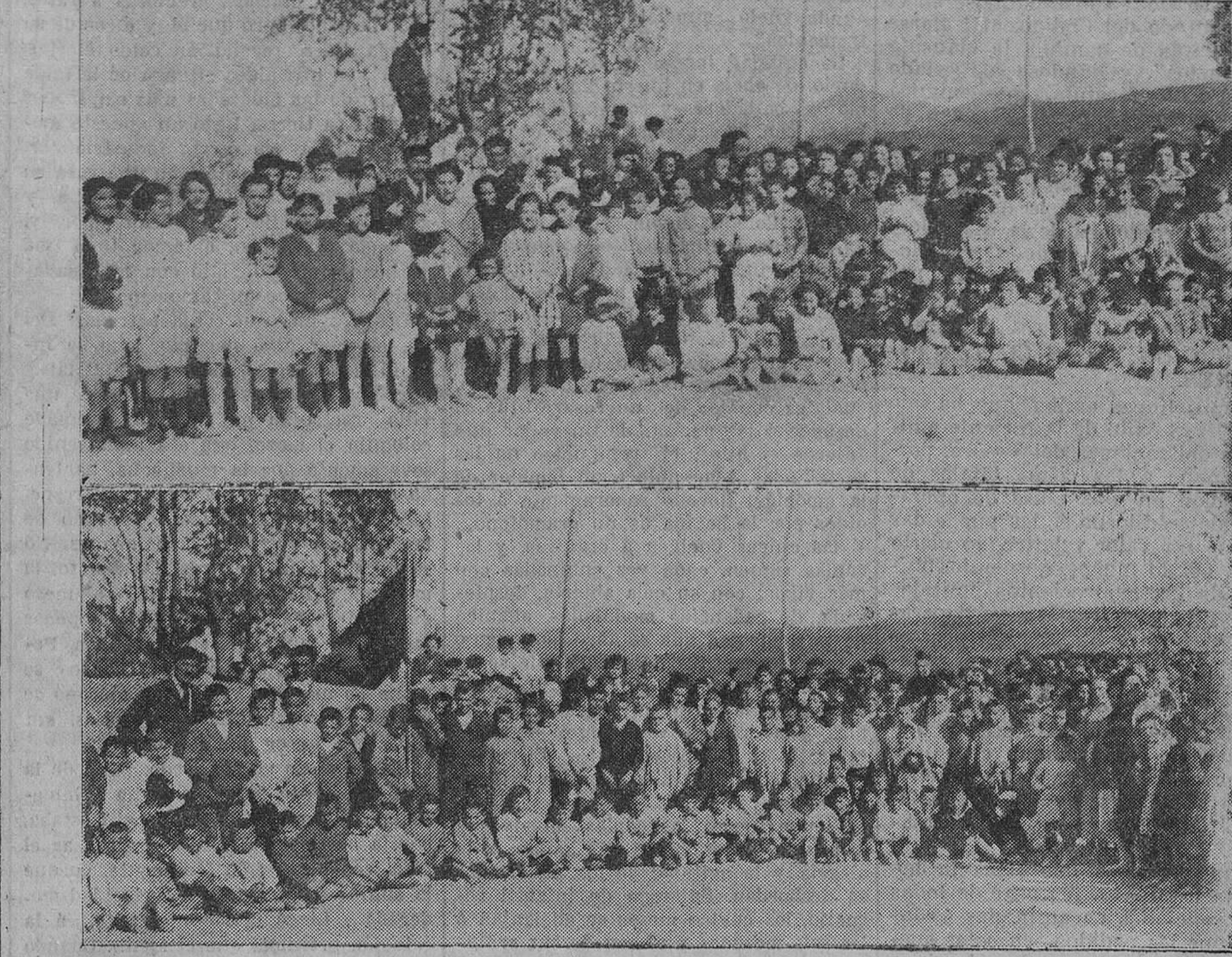
PARBAYON.—1. y 2. Grupos de las niños y niñas que concurrieron á la Fiesta del Arbol.

Proponemos como medio para coadyuvar al desarrollo de esta industria, que por las Juntas vecinales ó Ayuntamientos dueños de terrenos inculcos, se destine, como ensayo, una superficie de diez hectáreas, por ejemplo, á formar prados, para lo que, sin desembolso ó con gasto reducido, podría seguirse el procedimiento de adjudicar por un plazo de diez años dichos terrenos, mediante su subasta, á un particular ó Sociedad, que podría ser la misma que trata de establecer la citada industria, si comprendiendo sus intereses, coadyuva á esta labor, estableciéndose la condición de transformar el terreno en prado en el plazo que se fije, empleando los abonos adecuados, con derecho á tener cerrado el terreno todo el primer año y de enero á julio en los restantes, realizando en este tiempo los cortes de yerba que le convenga, y pasado el mes de julio obligarse á abrirlo al pastoreo por los ganados de todos los vecinos que tengan derecho á ello, con lo que estos ganados en nada se perjudicarían, porque los pastos que se pro-