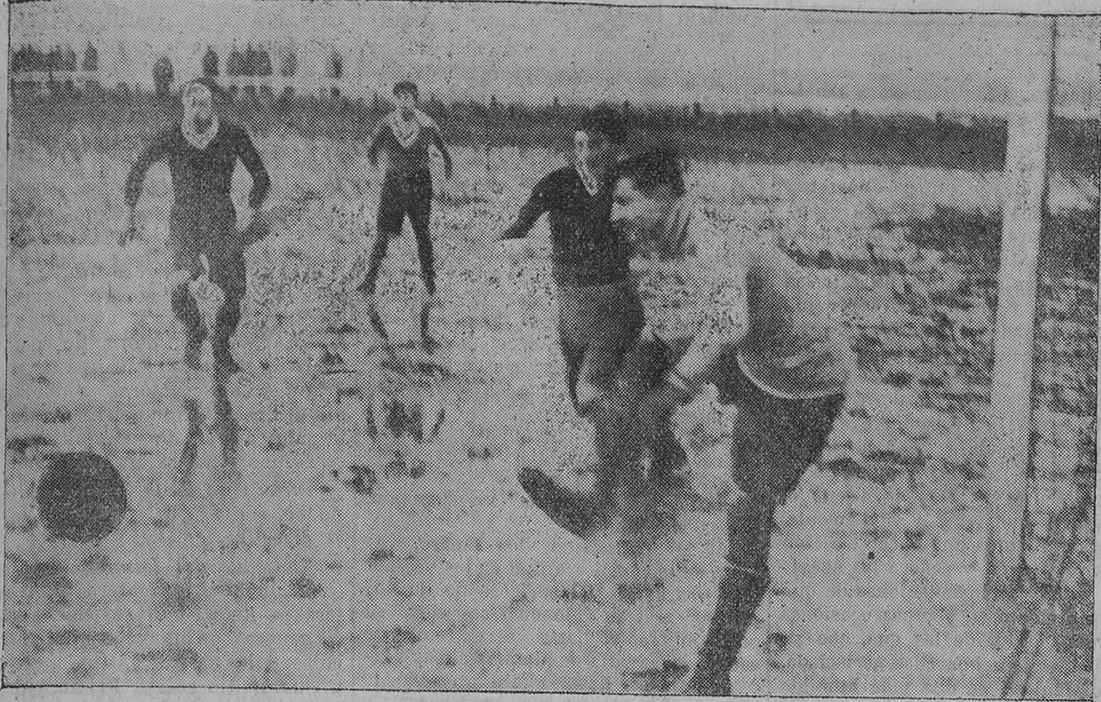
Un detalle del encuentro Muriedas F. C.—Unión Montañesa, jugado el domingo en Miramar. En la fotografía se aprecia el estado fangoso del terreno, poblado de grandes charcos, en los que, como en un espejo, se reproducen las figuras de los jugadores.