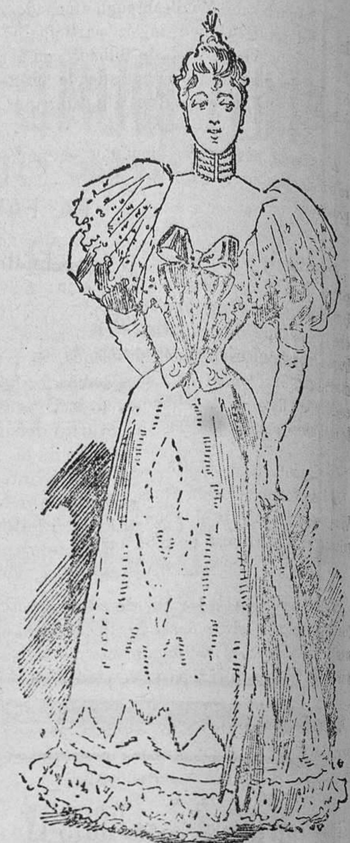
“Toilette” de recepción

El cuerpo de pure rosa está descotado en cuadro; se abrocha por una hilera de pequeños botones en lo que forma el corselete, y lleva sobrepuesta una berta de encaje de Bruselas que da la vuelta al escote, marca hombrera sobre una corta y bullonada manga, y cae por delante en disminución, hasta unirse al corselete.