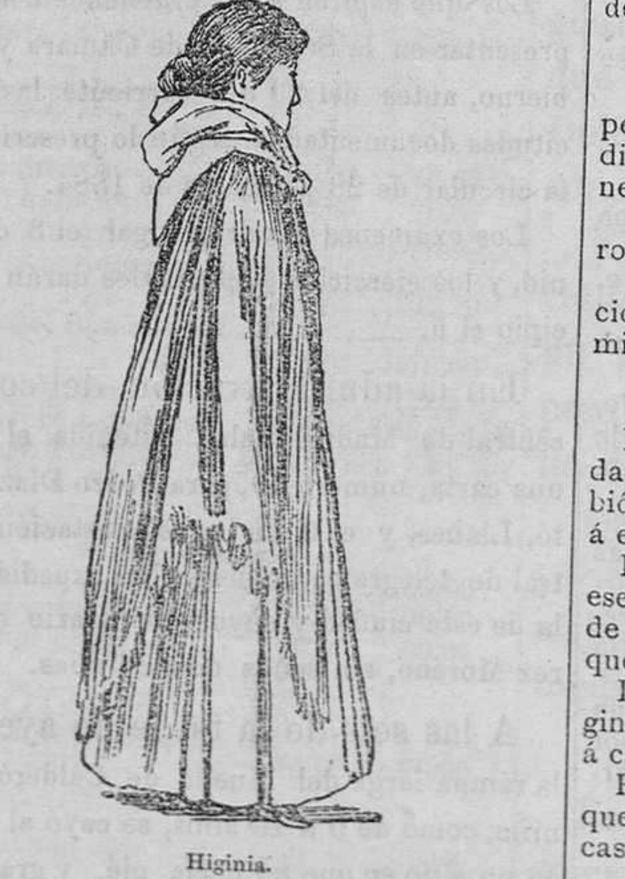
Higinia. Se conoce que á cerciorarse de esto se reducía la visita de anoche, porque una vez dormida, Higinia no sufrió ningún interrogatorio.

Es decir que contra todos los cálculos y acaso por vez primera de su vida, Higinia resultó buen sujeto.