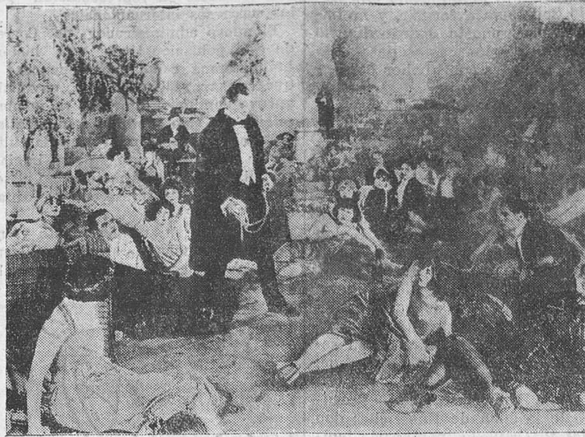
Una de las escenas de "Los enemigos de la mujer", que se estrena hoy en el Gran Cineama.

La constitución de la Sociedad indicada y su funcionamiento en el sentido indicado para bien de Santander y la Montaña, puede ser el principio metódico, bien desarrollado, de la iniciación del turismo montañoso, y desde luego representa una gran mejora para el servicio del transporte de viajeros en la ciudad y entre ésta y el Sardinero, lo cual constituye ya un hecho de importancia.