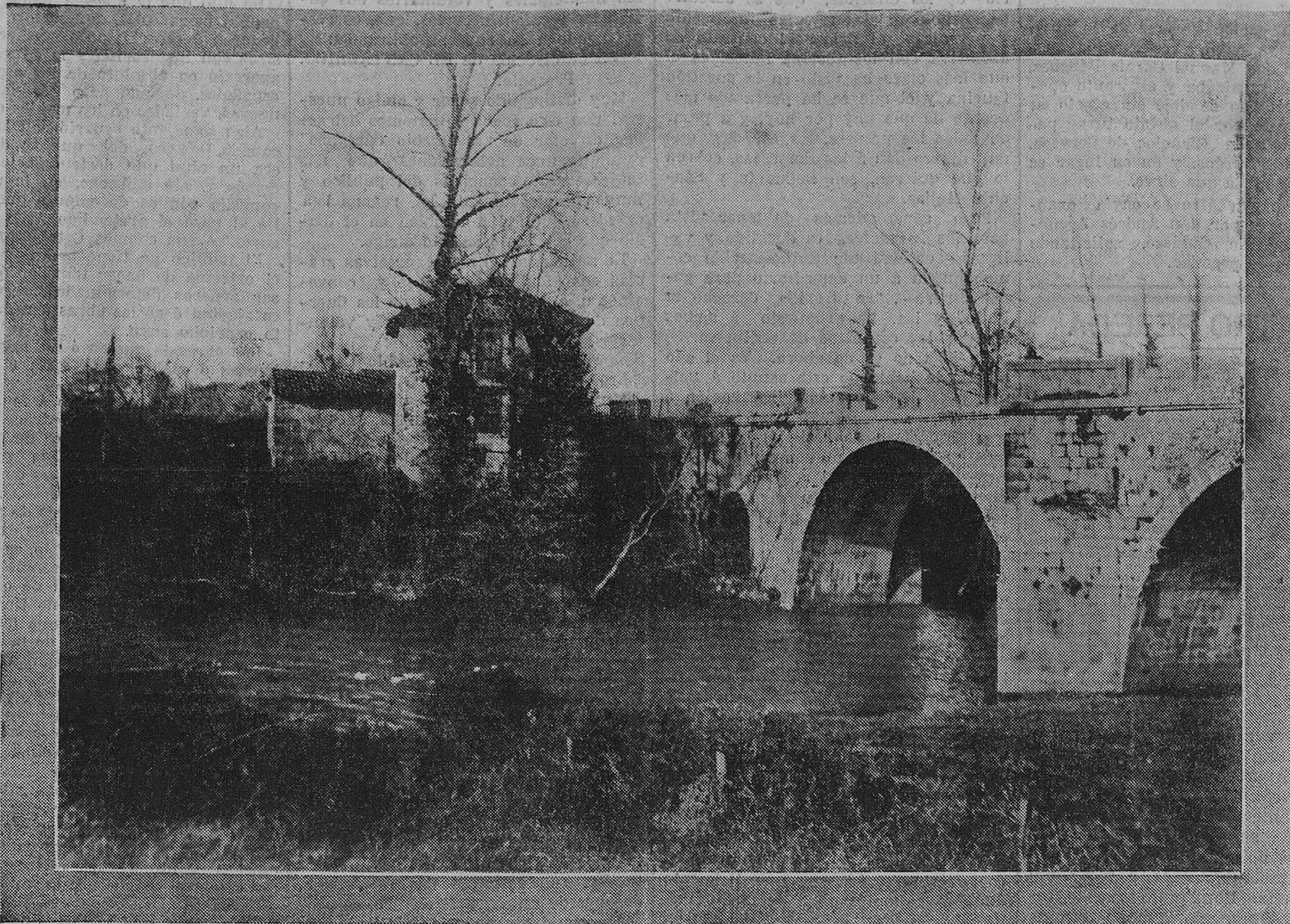
BELLO PAISAJE MONTAÑÉS

Esto quizá sea cierto, como también que la opinión, cansada de balancines eclecticos, antes de hundirse en las negruras de un escepticismo lamentable, vaya á engrosar la política extrema de los partidos más radicales, lo mismo en el sentido reaccionario que