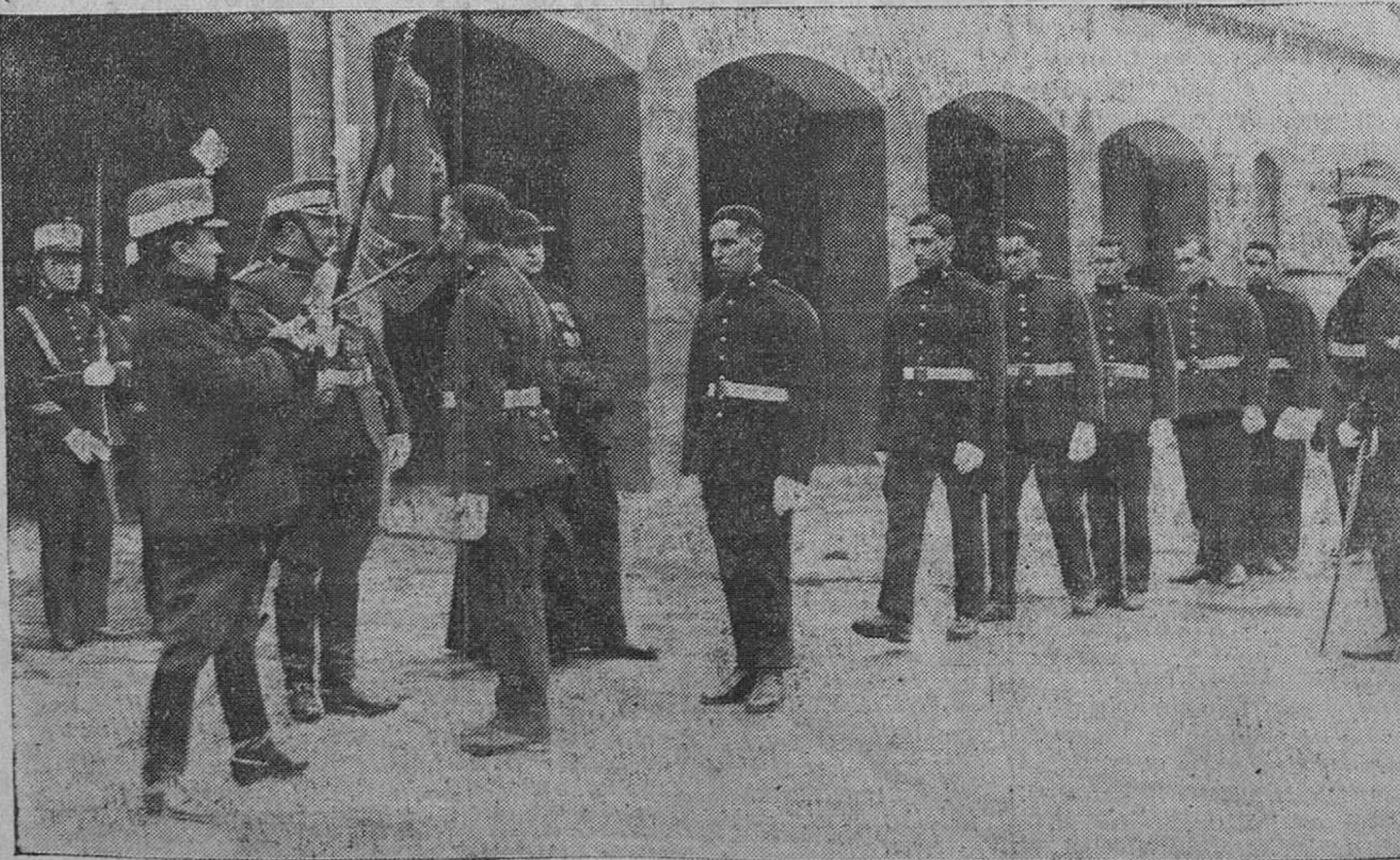
SANTONA.—Jura de la bandera por los reclutas del regimiento de artillería.