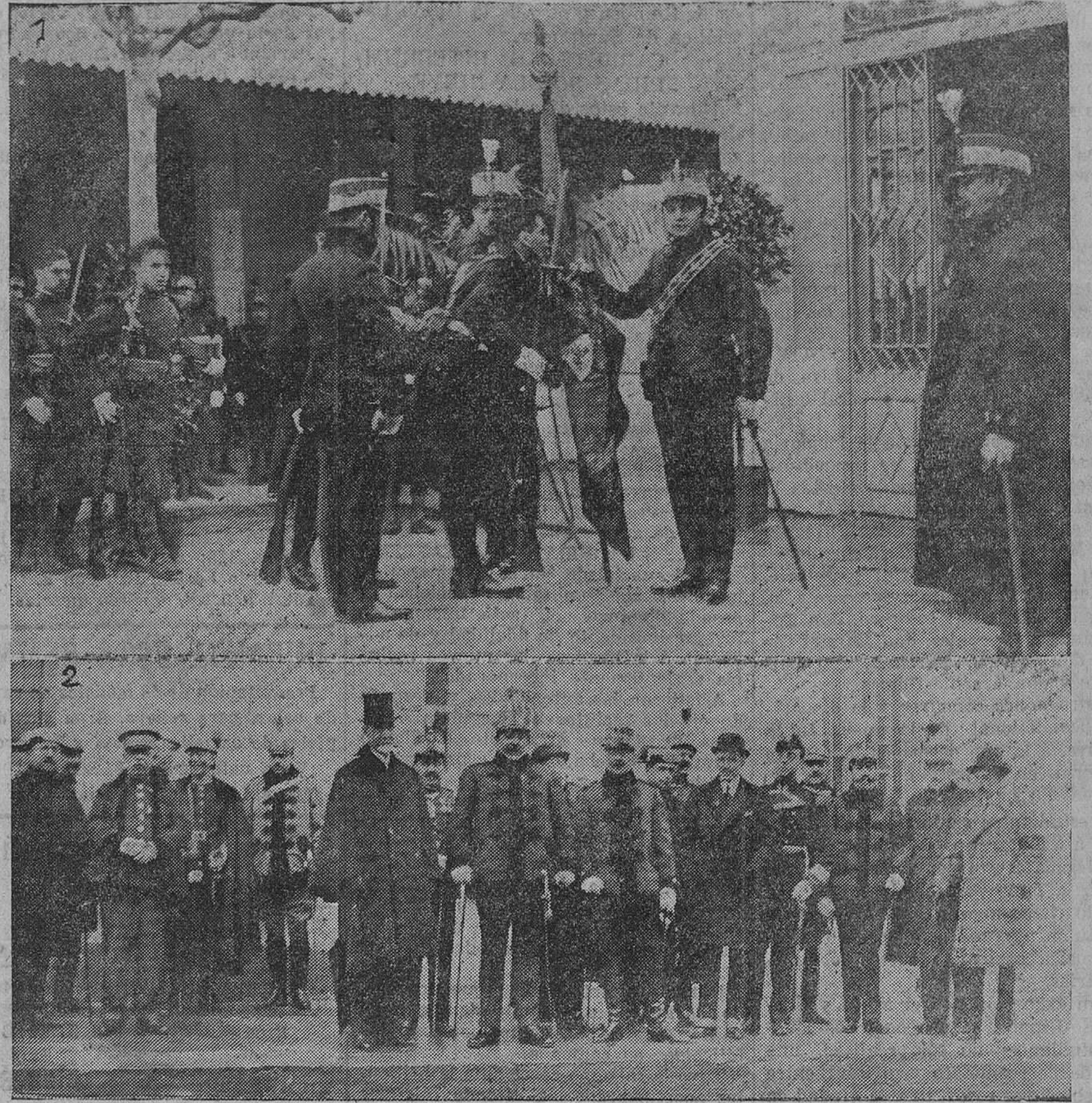
LA JURA DE LA BANDERA EN EL CUARTEL DE MARIA CRISTINA.—Un soldado besando la enseña de la patria. Las autoridades presenciando el desfile de las fuerzas.

ANTONIO ALBERDI Vías urinarias, partos y enfermedades de la mujer. - DIATERMIA. Consulta de diez á una y de tres á cinco, Amós de Escalante, 19. Teléfono 8-74.