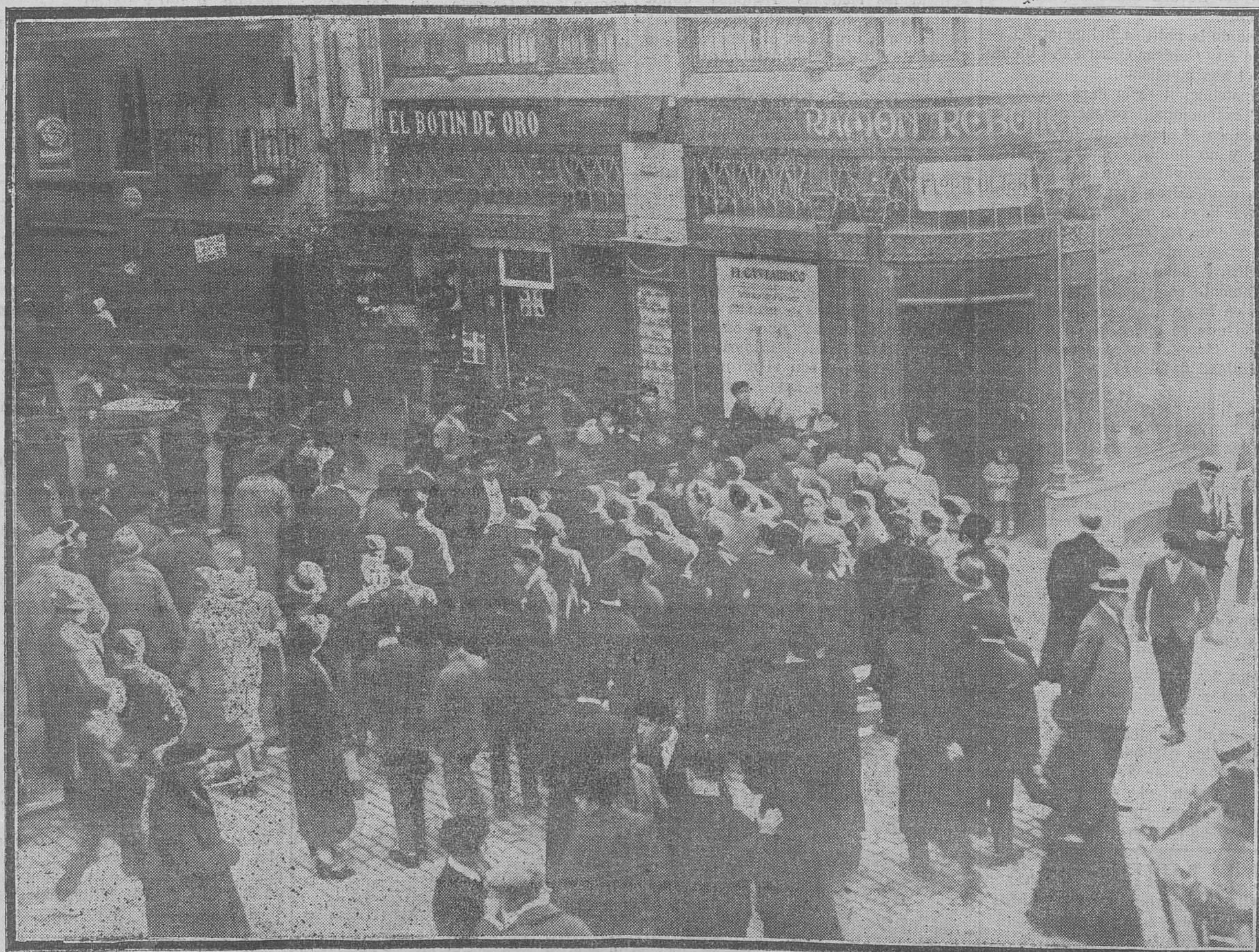
EL SORTEO DE NAVIDAD. El público, que fue, en busca de una grata impresión, á leer la cartefera de EL CANTABRICO, comenta con disgusto la descortesía del gordo y de los gorditos, que no se han dignado esta vez venir á visitarnos.

"Señores! Ha llegado á la Tierrauca un señor que, por una pesetilla, se da cuatro mordiscos en la nuca ¡y uno en la rabadilla!"