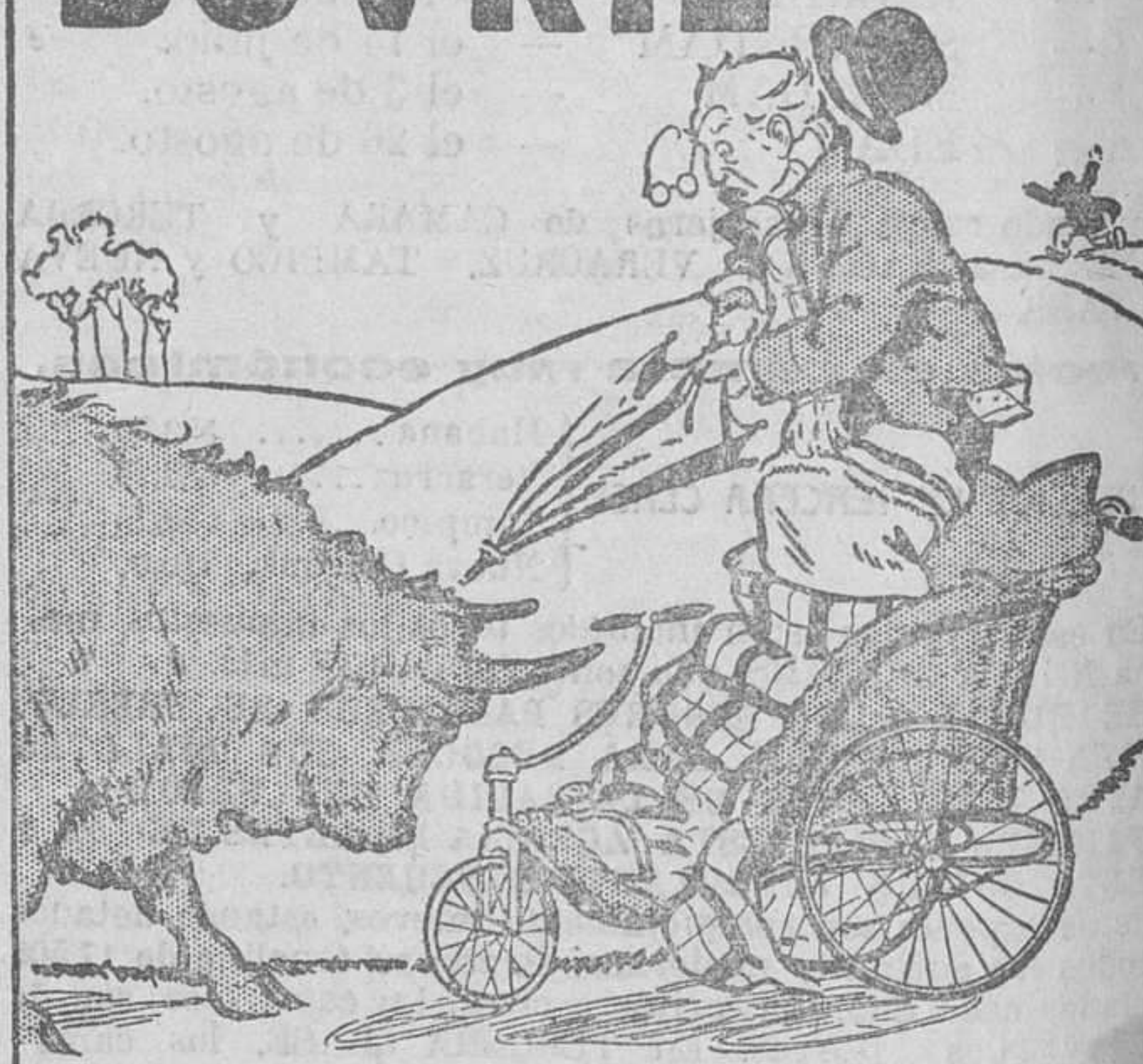
"Ante el Bovril las fuerzas pronto se recuperan."