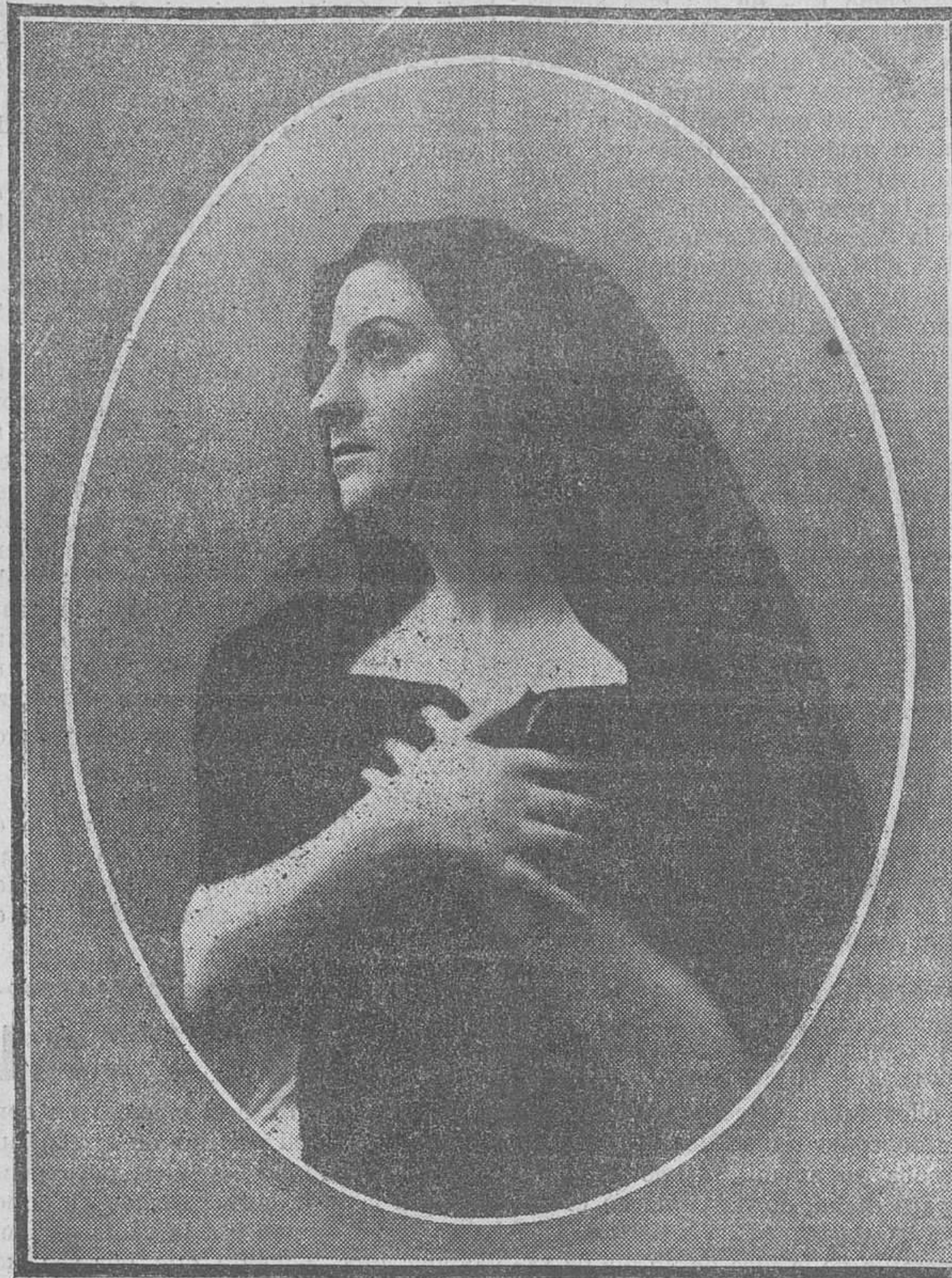
La notable típica cantante Tana Liuro, que celebra hoy su beneficio.