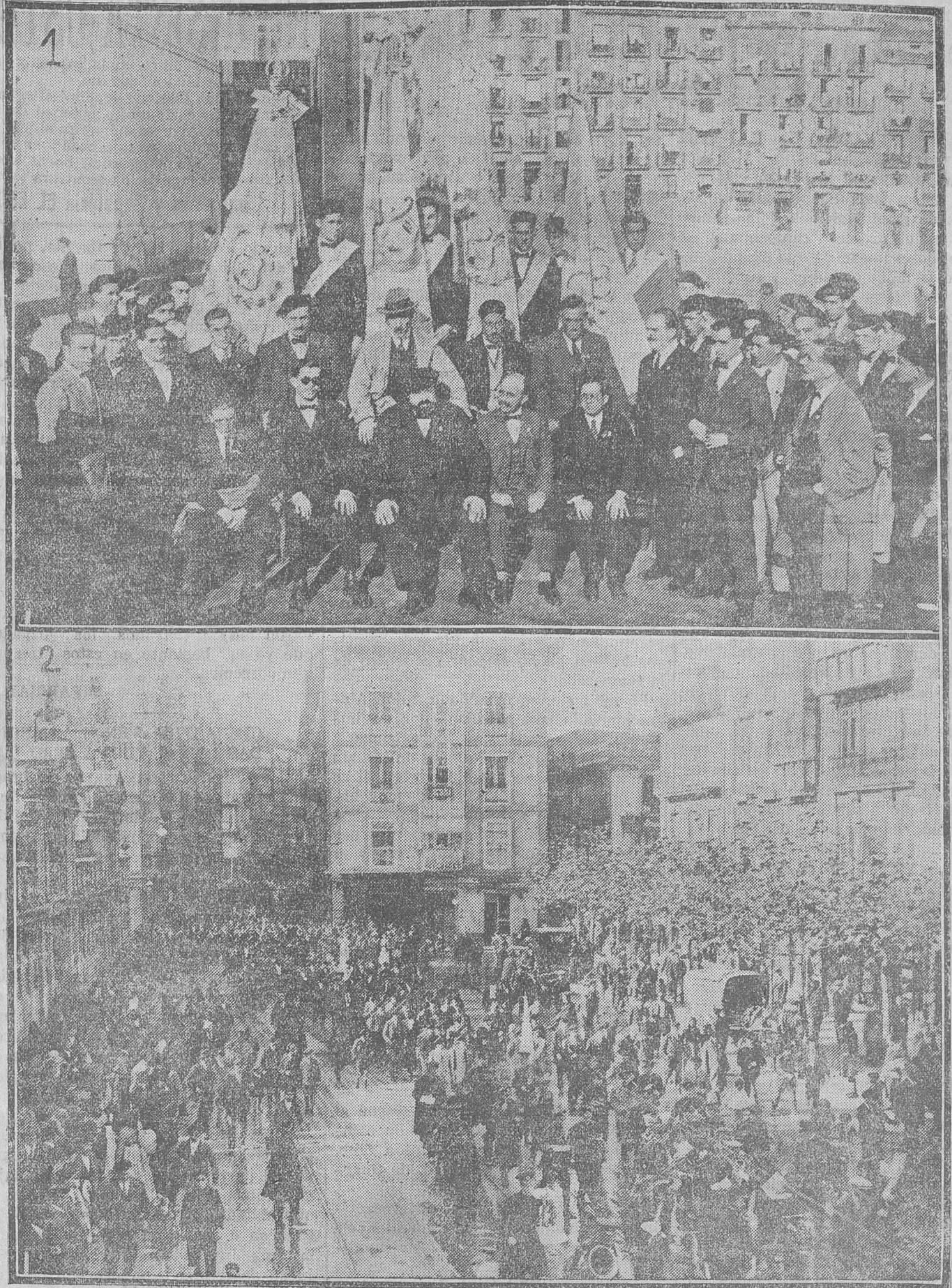
1. Las banderas de La Coral y de las masas corales de Astillero-Guarnizo, Camargo y Peñacastillo. — 2. Las sociedades corales al salir de la misa.

Tanto el coro de Retana "Las tres" como el magnífico coro montañés del inspirado compositor Carré "Luz y sombras", fueron cantados admirablemente por el orfeón de