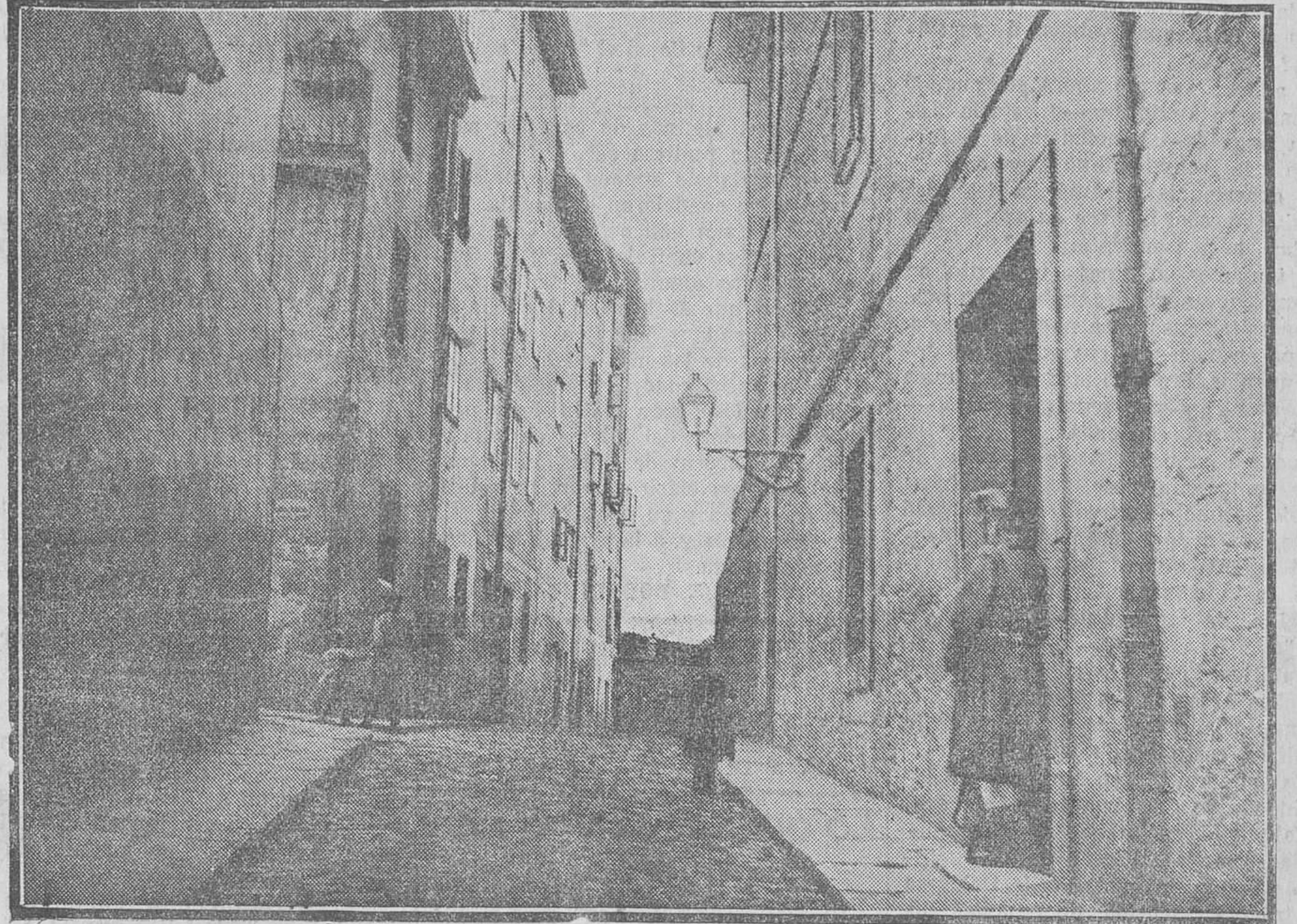
RINCONES SANTANDERINOS. -- He ahí una de nuestras calles más viejas y más típicas, la de Santa María Egipcíaca. En ella está la cárcel, el vetusto edificio, húmedo, que tanto contrasta con las construcciones del Duco. "¿Cuándo será esa cárcel sustituida?", se preguntará, al ver esta fotografía, quien odia al delito y compadece al delincuente.

"El objetivo primordial perseguido por nuestro club es convencer a los jóvenes solteros de que el matrimonio no significa necesariamente para ellos sumisión a los caprichos de una suegra. Los caricaturistas y los maridos incumplidores de sus deberes conyugales, son responsables de la leyenda acerca de la arbitrariedad y el egoísmo de las madres políticas. ¿Acaso el hecho de que se case un hijo o una hija convierte por ley inmutable a la madre en un ser anormal?"