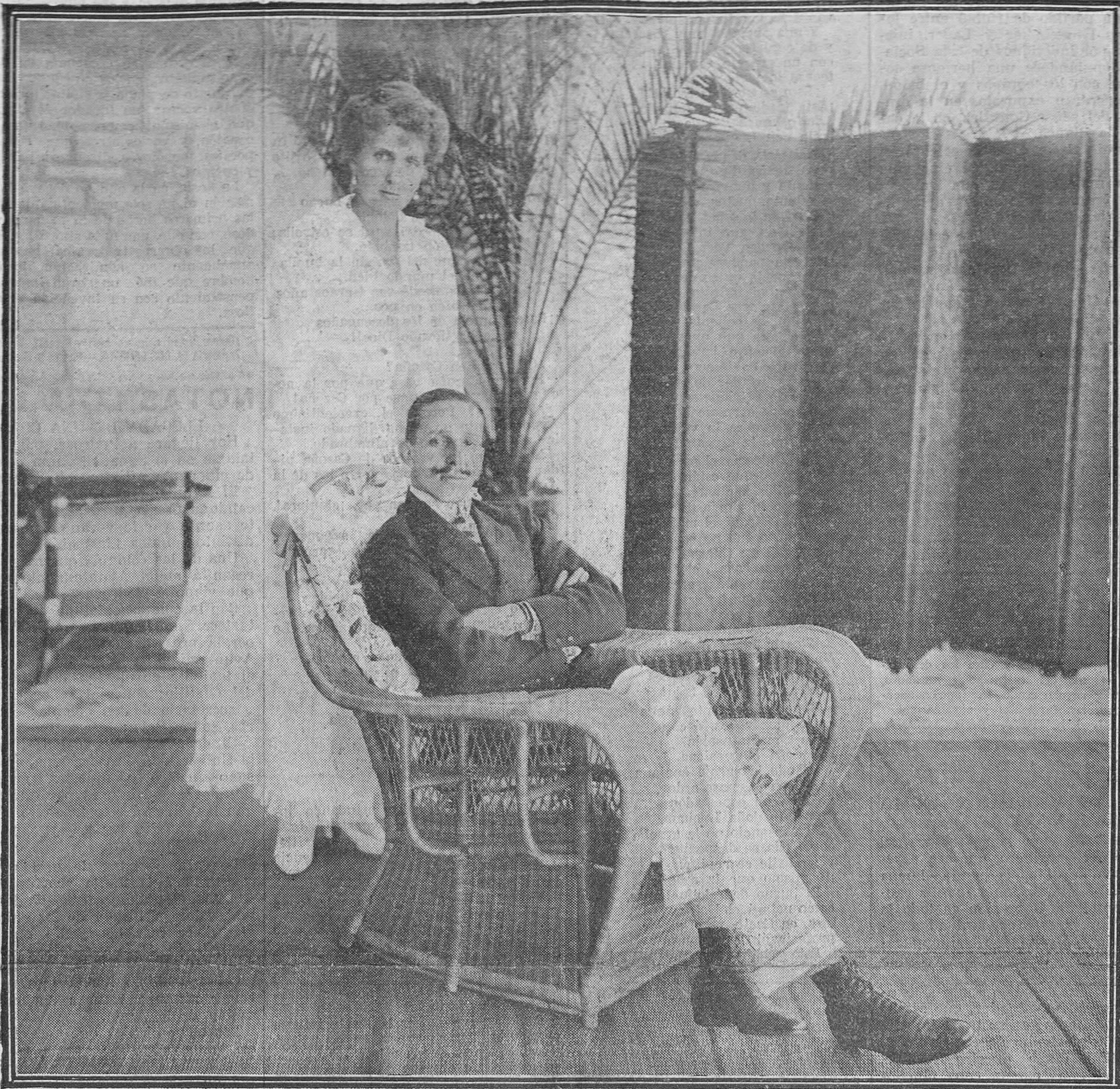
En esta admirable fotografía, parece que la Reina doña Victoria, tan enamorada de la poética belleza de nuestras playas, le está diciendo, al oído, á su augusto esposo: "¡Protege á Santander!"

Doctor J. MURIEDAS Especialista en garganta, oídos y nariz. Consulta de 9 á 12 y de 2 á 3.—Doct. en Velarde, 4, segundo.—Santander.