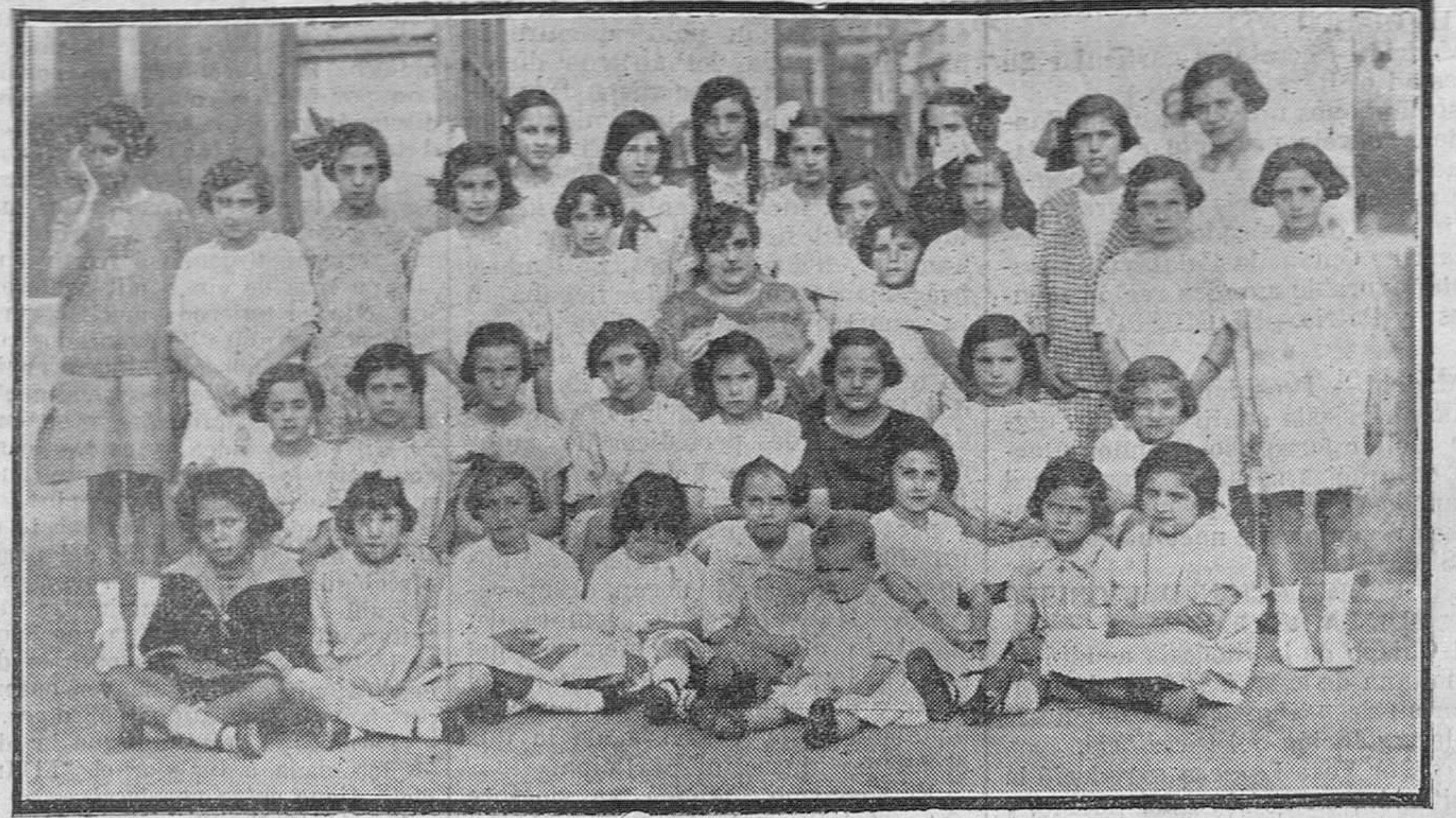
Grupo de aplicadas niñas que presentan sus trabajos en la exposición de la escuela municipal Segunda del Este.