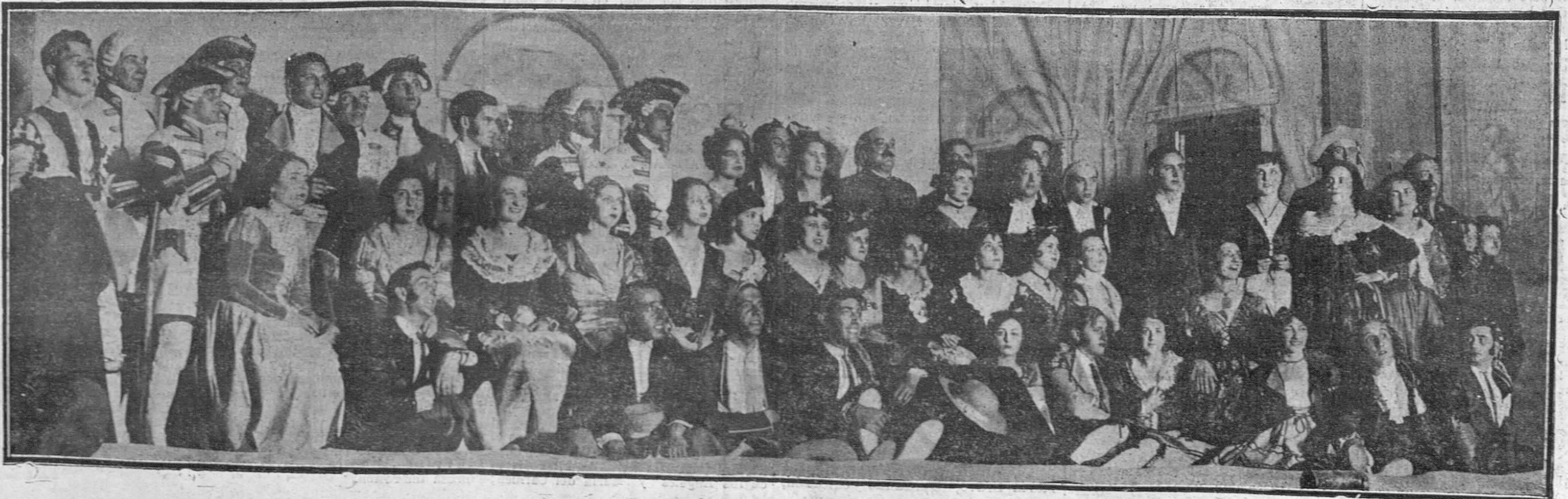
Distiguídos jóvenes de la sociedad santanderina, intérpretes de la zarzuela "El Barberillo de Lavaplés", representada anoche en el Teatro Perea a beneficio de la Cruz Roja.