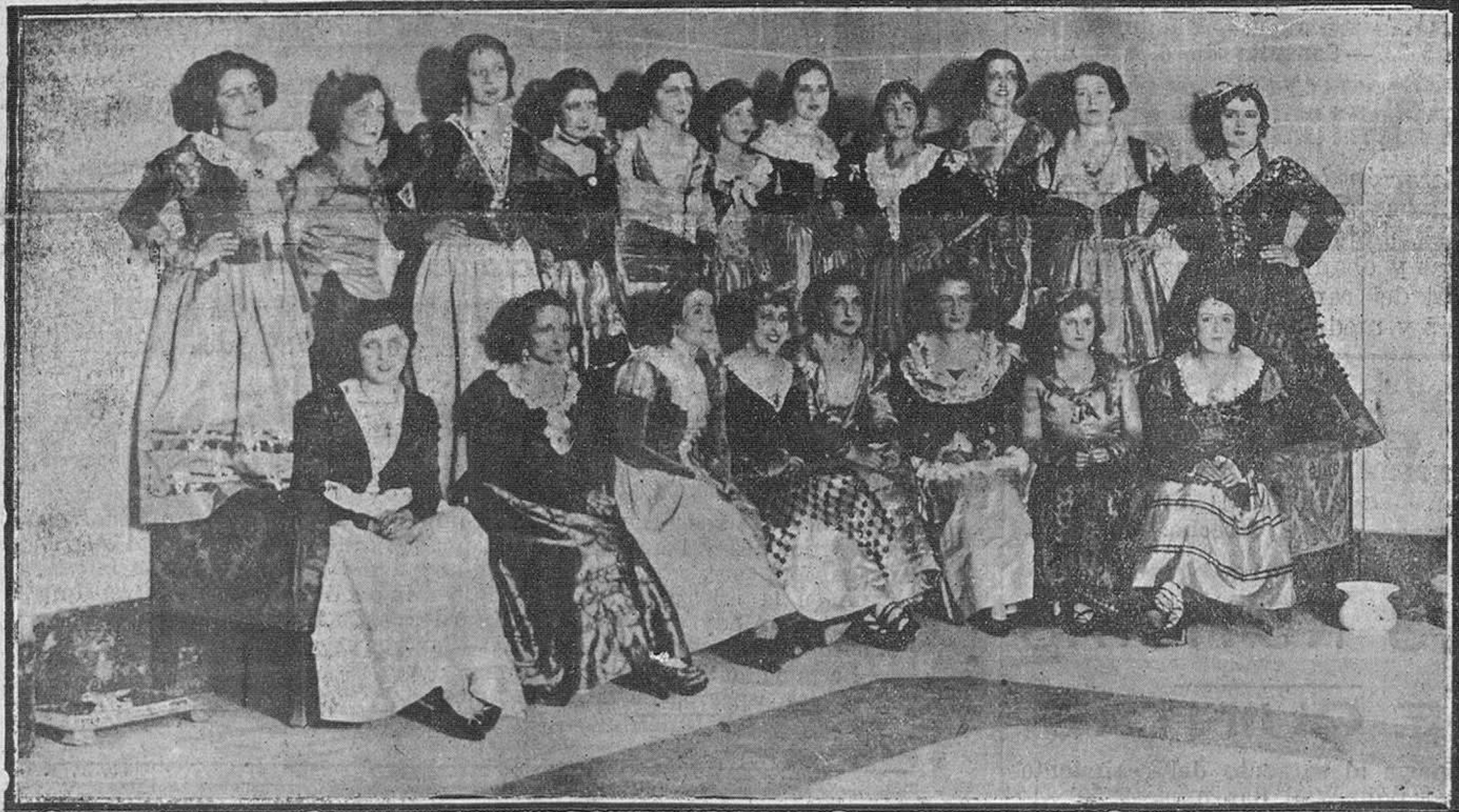
Bellas señoritas que formaban en el coro de la zarzuela "El Barberillo de Lavaplés".