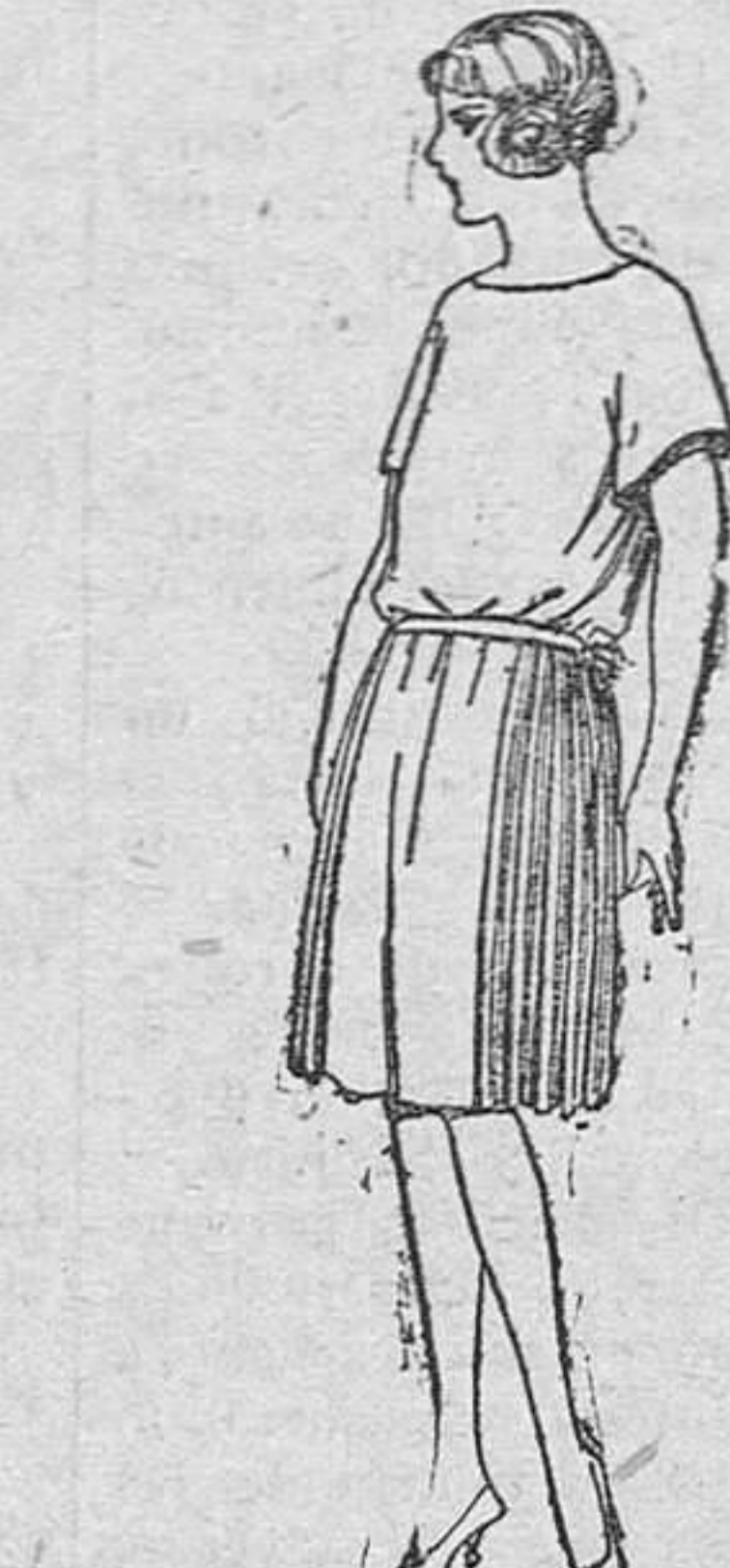
Vestidos de sarga inglesa, gabardina, etc., en azul y color, adornado de pespunte seda, de ptas. 55 á 70.