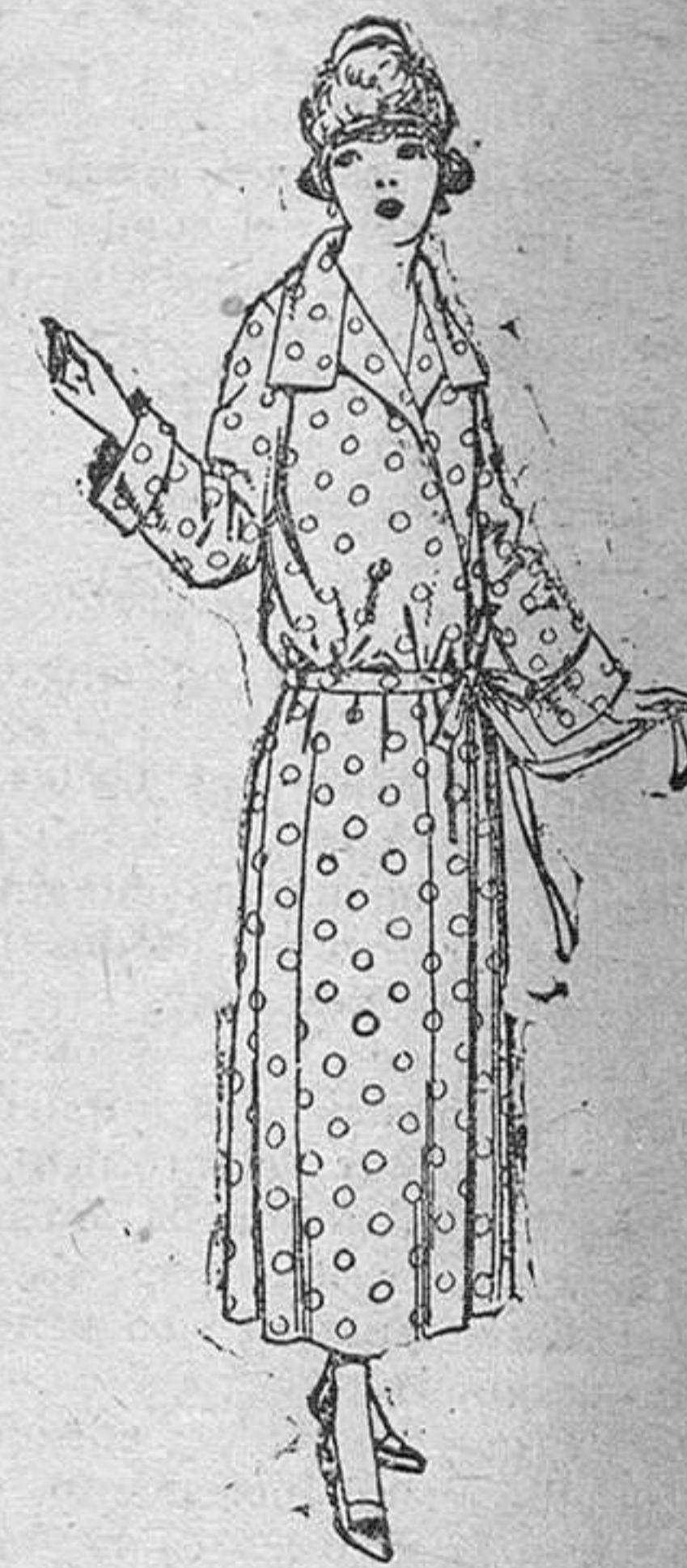
Batas de percal, voile listado, etcétera, de ptas. 16 á 23.