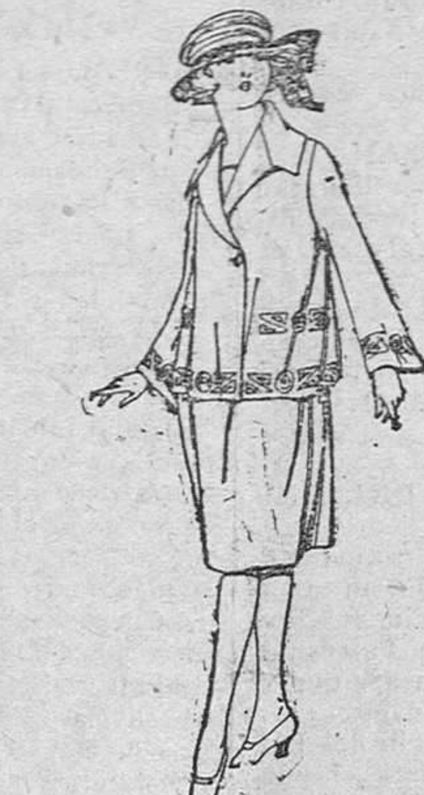
Vestidos de gabardina, sarga inglesa, etc., en azul y color, adornos bordados, para jovencitas de 13 á 15 años, de pesetas 93 á 110.