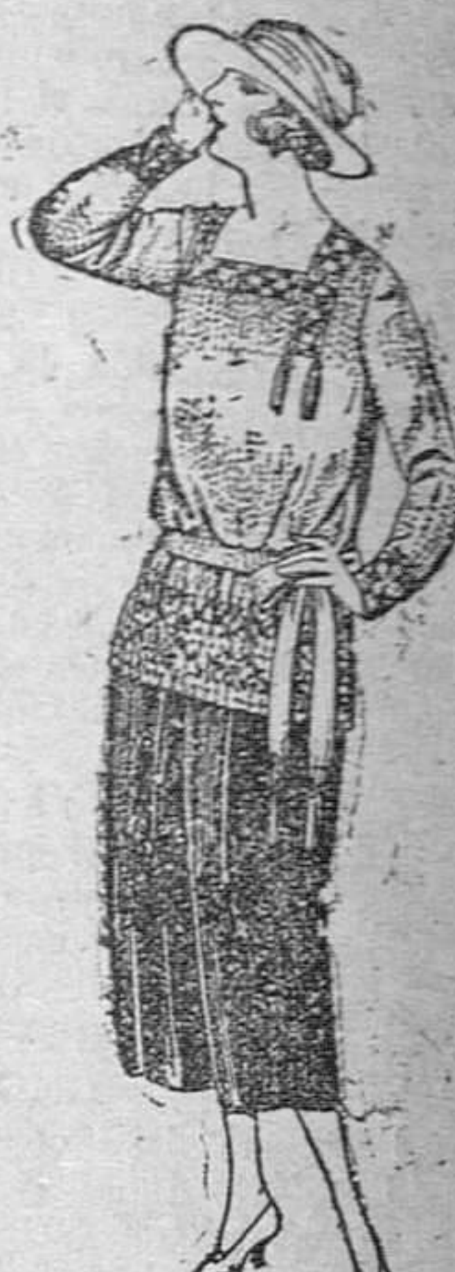
Palotots de punto de lana, en negro y colores, de pesetas 22 á 110.