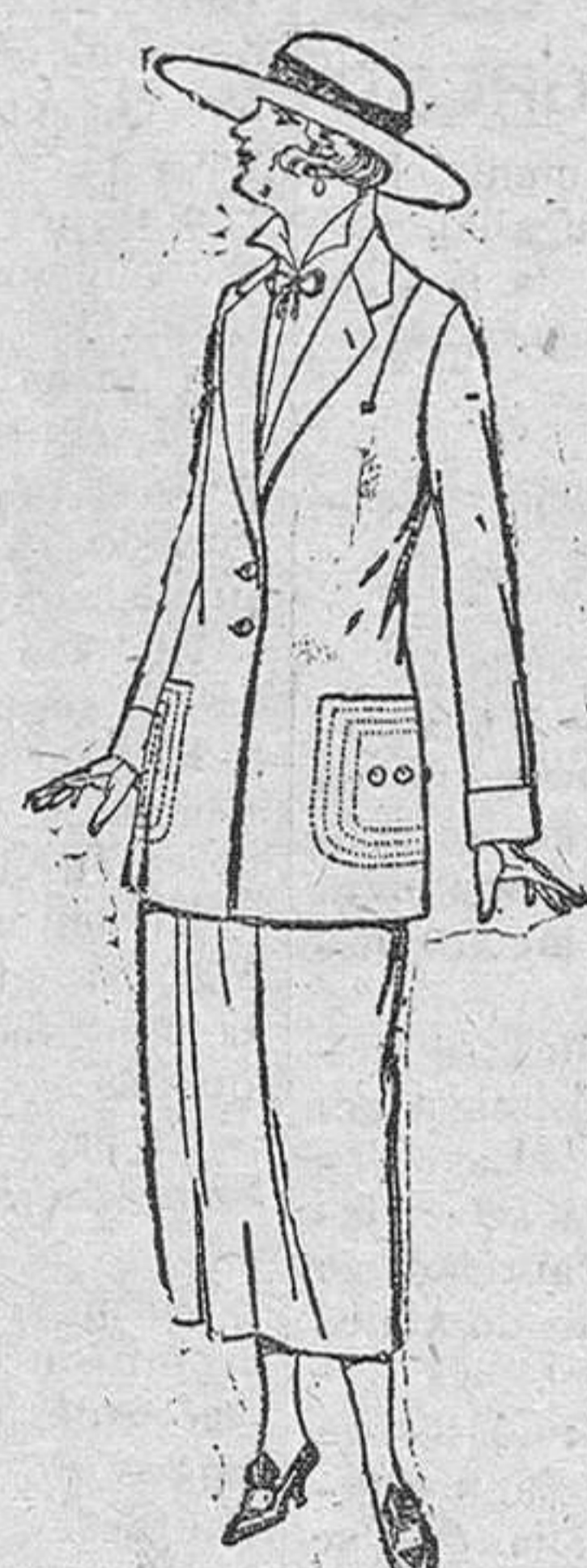
Trajes sastre, de popeline, gabardina, etc., adornos pespunte seda, chaqueta forrada de seda, en negro, marino y colores moda, de pesetas 120 á 140.