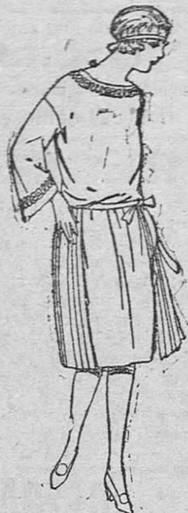
Vestidos de popeline, sarga inglesa, etc., en azul y color, adornos bordados, para jovencitas de 13 á 15 años, de pesetas 60 á 78.