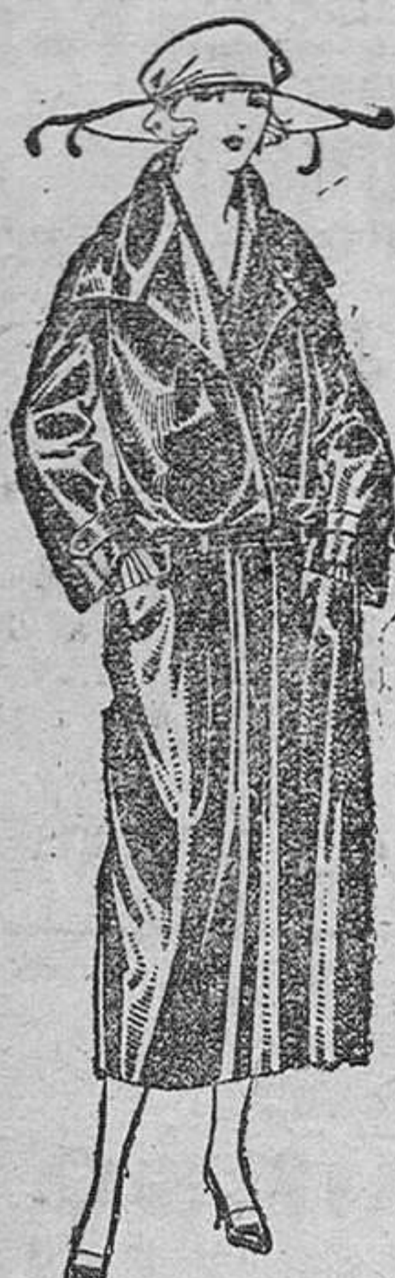
Abrigos de seda impermeables, en negro, azul y color, de ptas. 1.00 á 1.225.