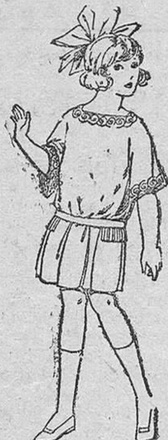
Vestidos de sarga inglesa, popeline, etc., en azul y colores moda, para niñas de 4 á 9 años, de pesetas 33 á 38.