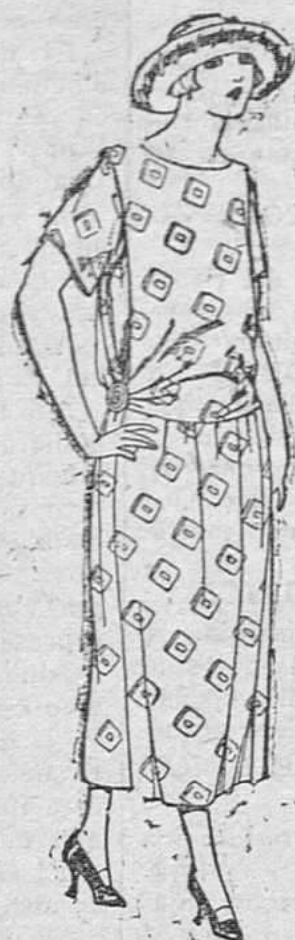
Vestidos de foulard de algodón, dibujos fantasma, de 35 á 50.