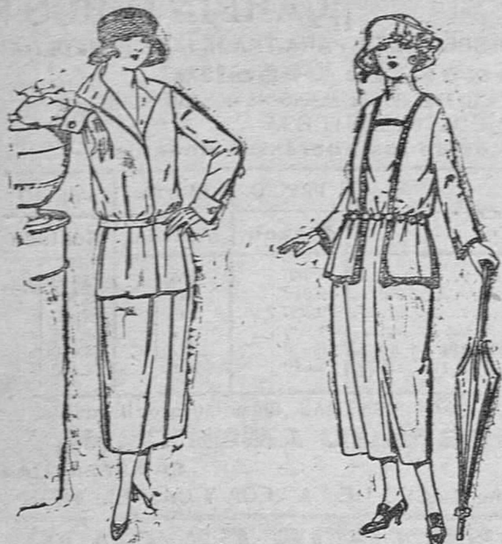
Trajes sastre de estambre, gabardina, etc., chaqueta forrada de seda, en negro, marino y colores moda, de pesetas 115 á 145.

SUCURSALES: Madrid, Barcelona, Alicante, Almería, Bilbao, Cádiz, Cartagena, Granada, Málaga, Sevilla, Palma de Mallorca, Valencia, Gijón, Valladolid, Zaragoza.