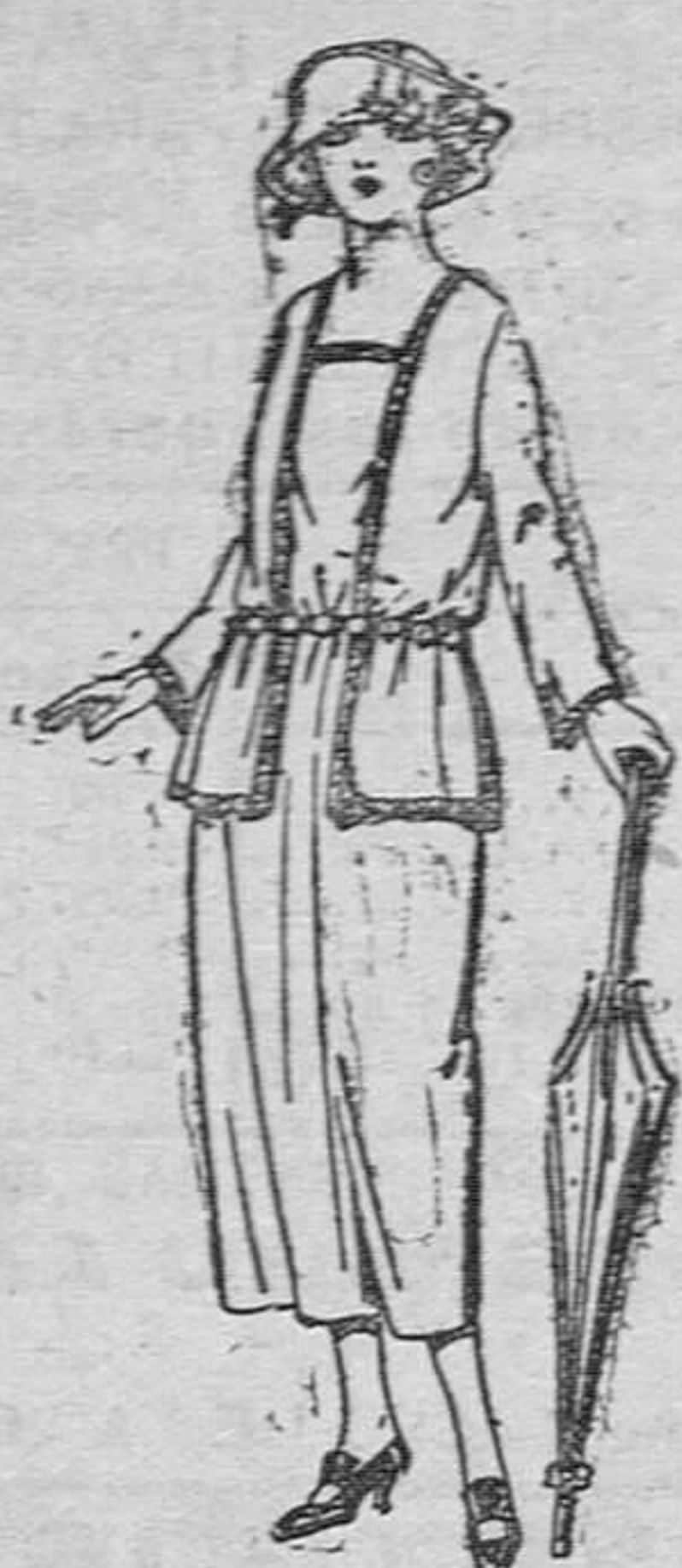
Vestidos de gabardina, sarga inglesa, etc., en azul y color, adornos modas, de ptas. 65 á 90.