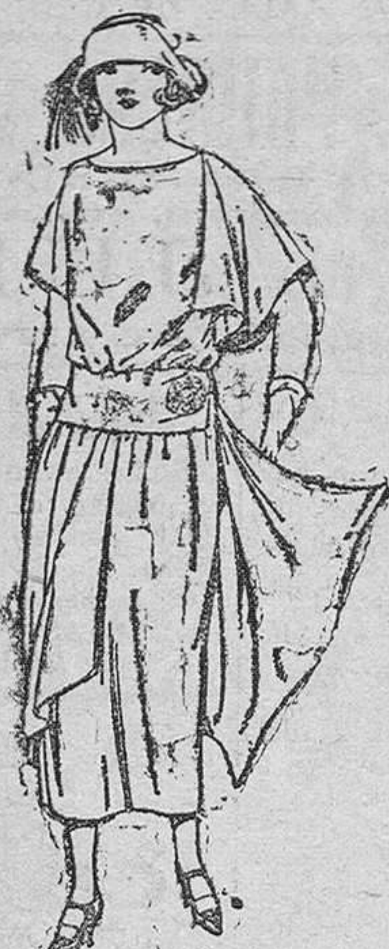
Vestidos de crepón de China, en negro, azul y colores modas, adornos hebillas metal, de ptas. 135 á 160.