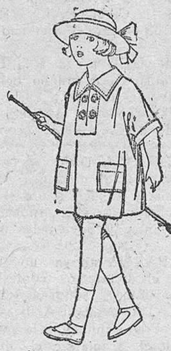
Vestidos de batista blanca, adornos bordados, para niñas de 3 á 6 años, de ptas. 6 á 8.

Boás, Camisería, Géneros de punto, Corbatería, Guantería, Sombrerería, Zapatería, Paraguas, Bastones, Sombrillas y Artículos de Viaje.