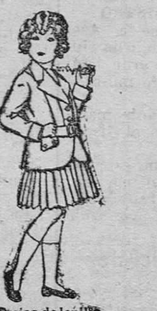
Trajes de lanilla para niñas de 4 á 12 años. De pesetas 20 á 55.