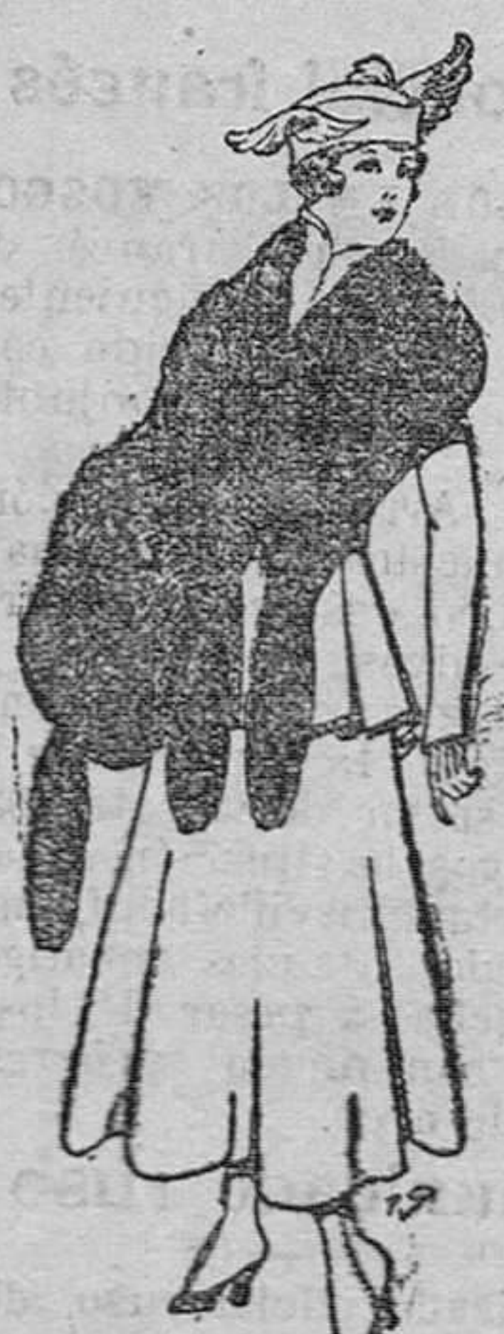
Juego de pelería, imitación perfecta al renard negro De pesetas 40 á 45.