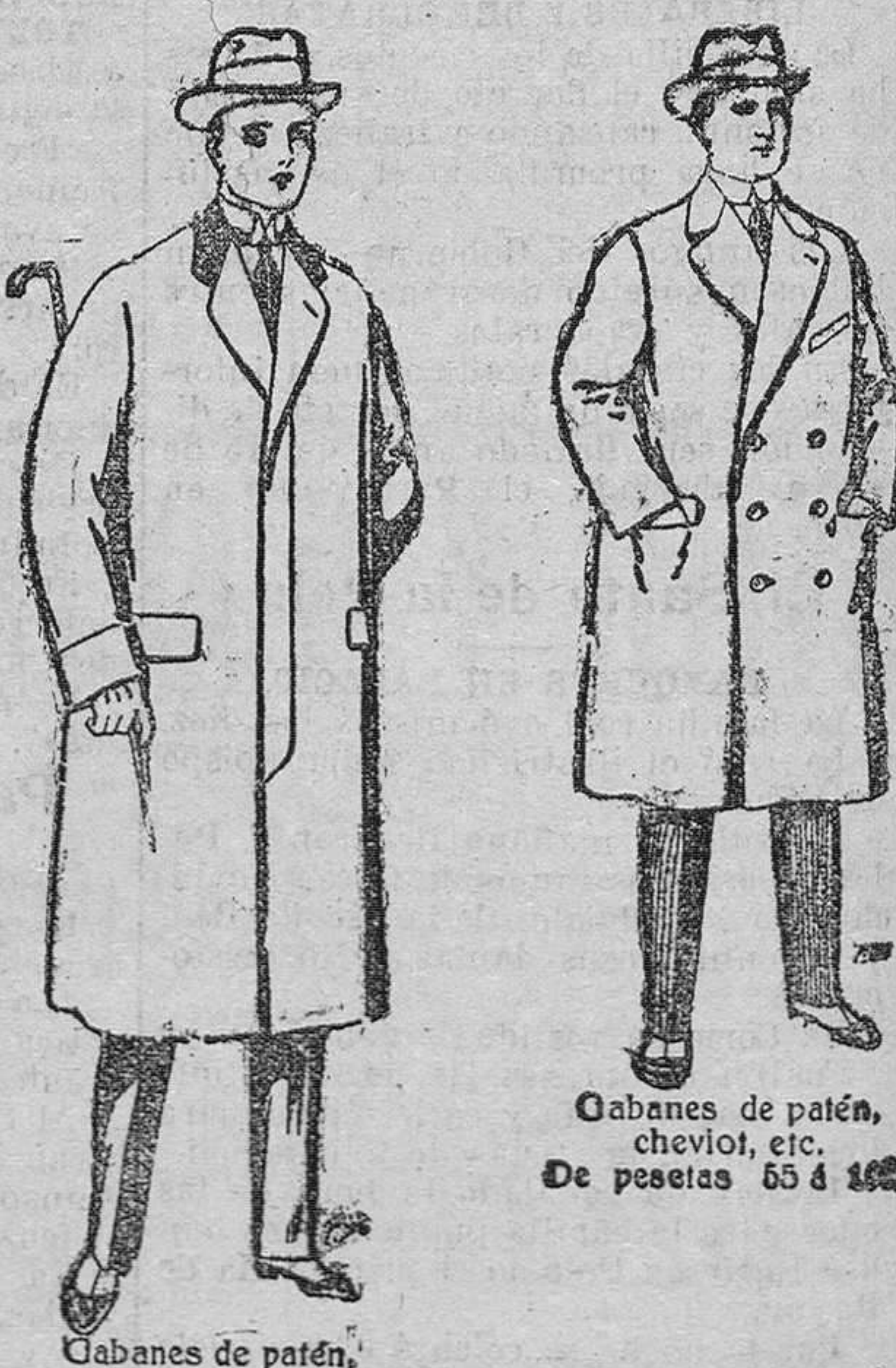
Cabanos de patén, cheviot, etc. De pesetas 55 á 120. Cabanos de patén, mellón y cheviot De pesetas 25 á 100.