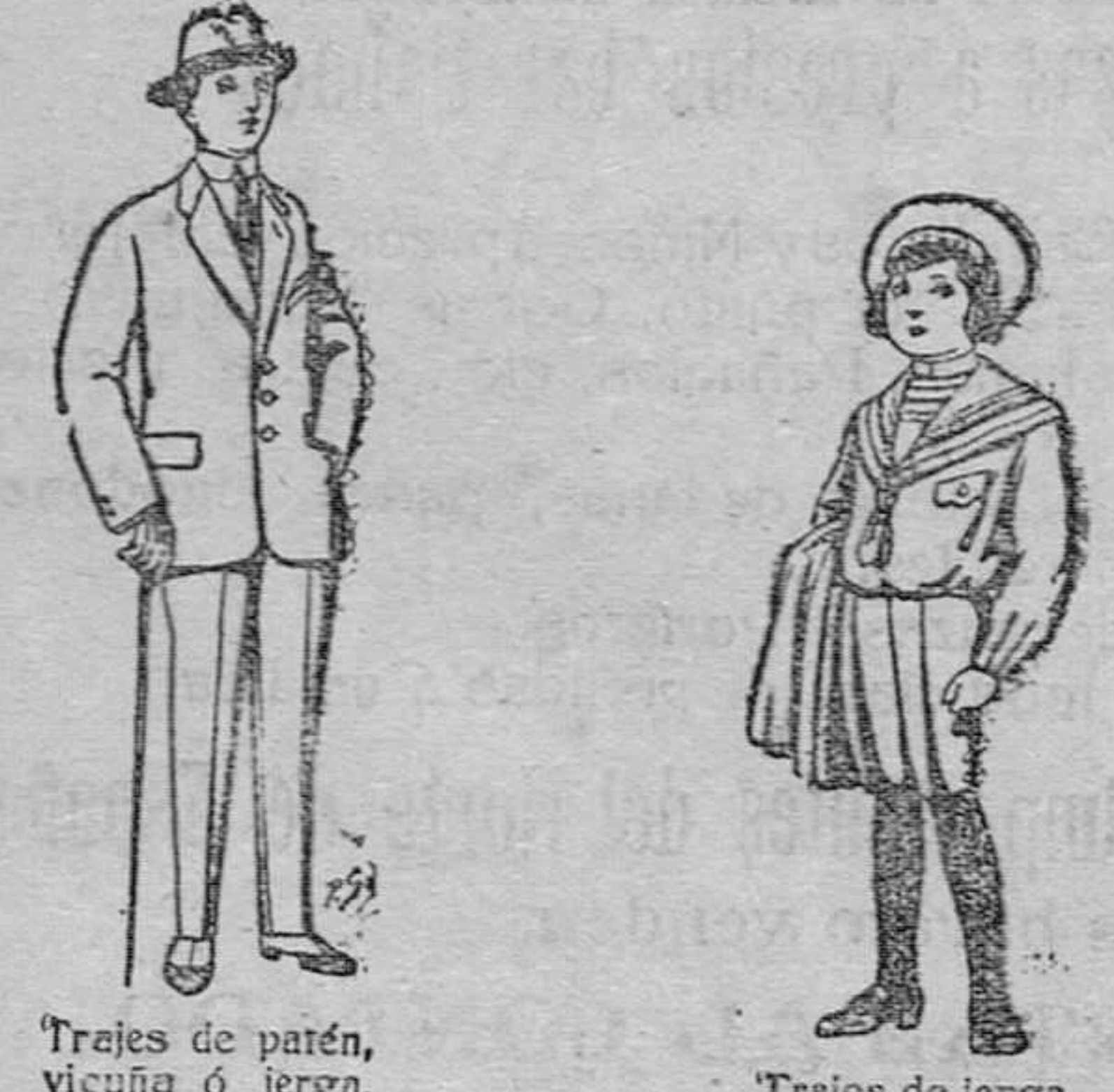
Trajes de patén, vicuña ó jerga, para niños de 10 á 16 años. De pesetas 14 á 50. Trajes de jerga, negra ó azul, para niños de 4 á 9 años. De pesetas 5 á 10.