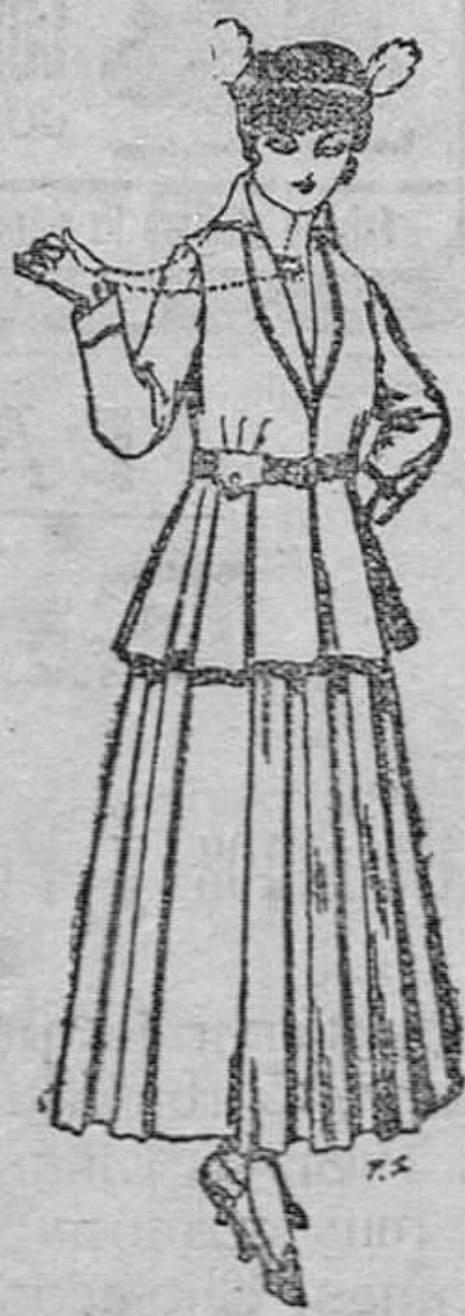
Trajes de lana negra, azul y color para señora á pesetas 65.