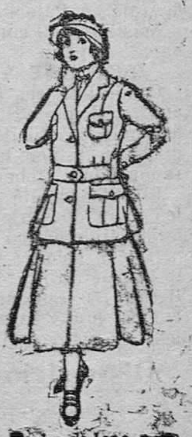
Trajes de lana, para jovencitas de 10 á 16 años. De pesetas 40 á 80.