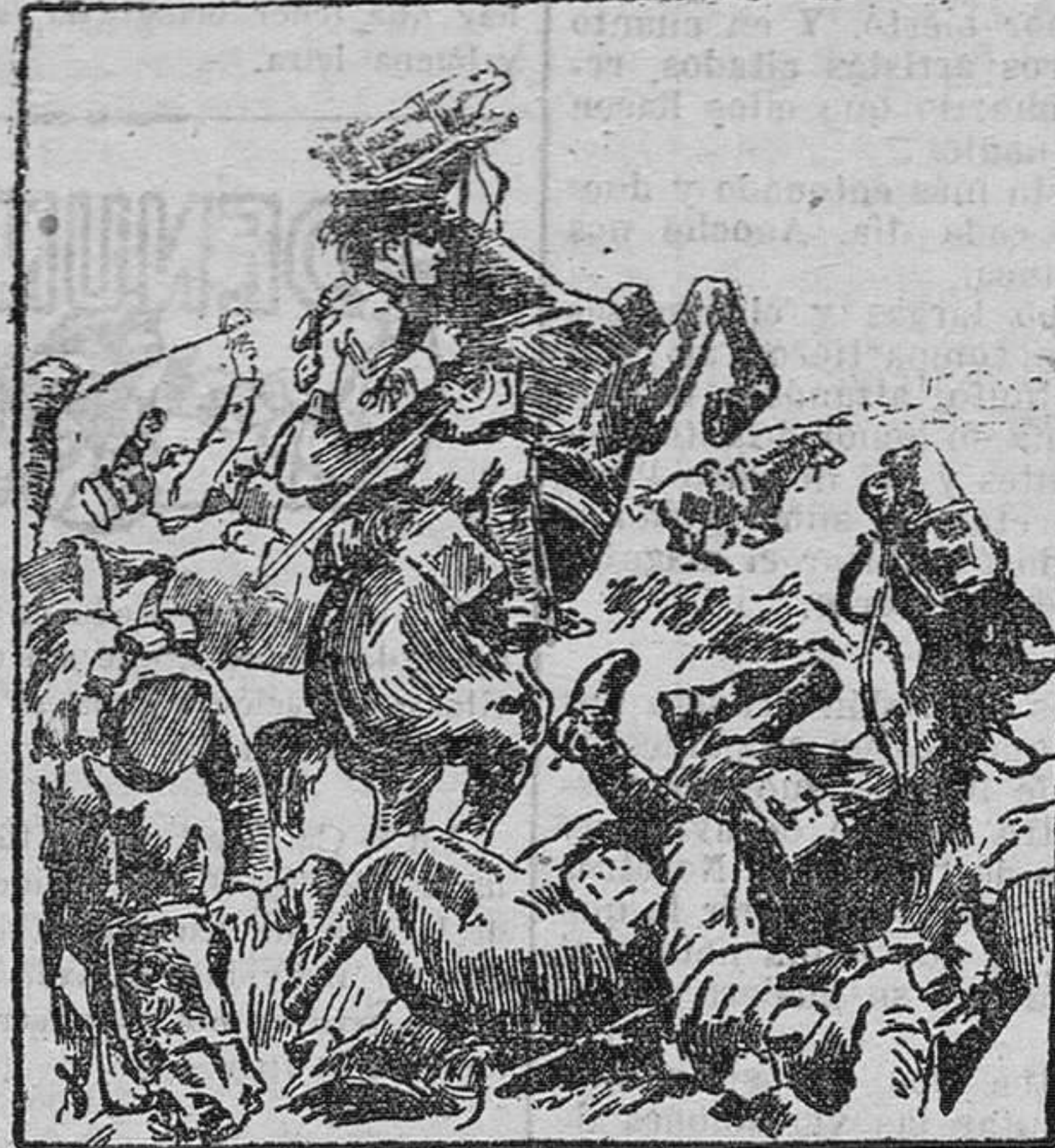
Una carga de caballería británica en las proximidades de Loos.