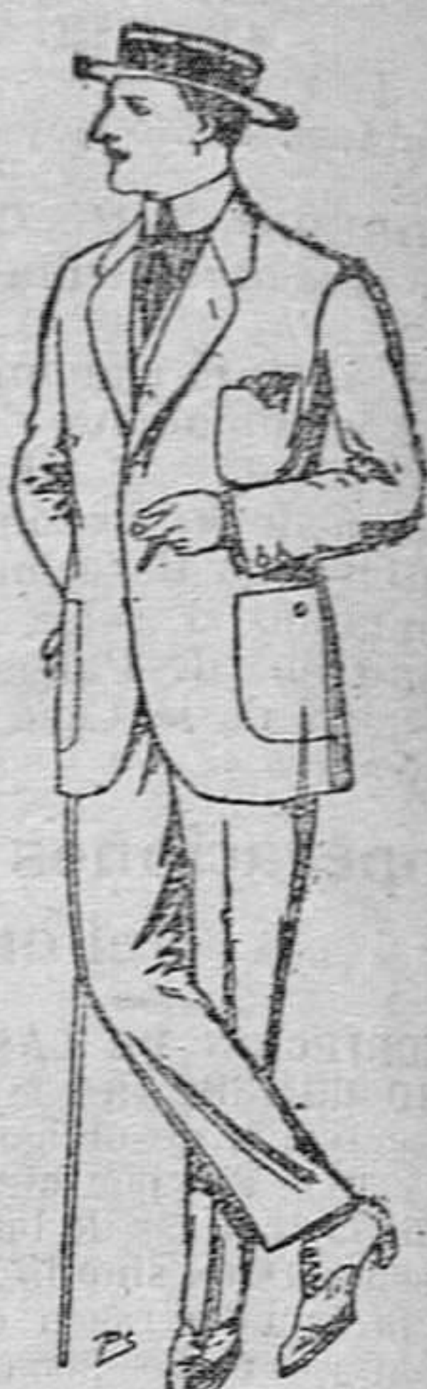
Trajes de dril crudo kaki ó listado, de PESETAS 10 á 23

Ropas confeccionadas para caballero, señora, niño y niña.