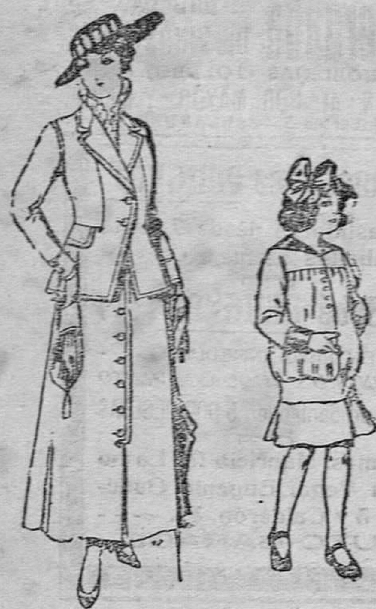
Trajes de lana negra, azul y color para señora, 4 PESETAS 40