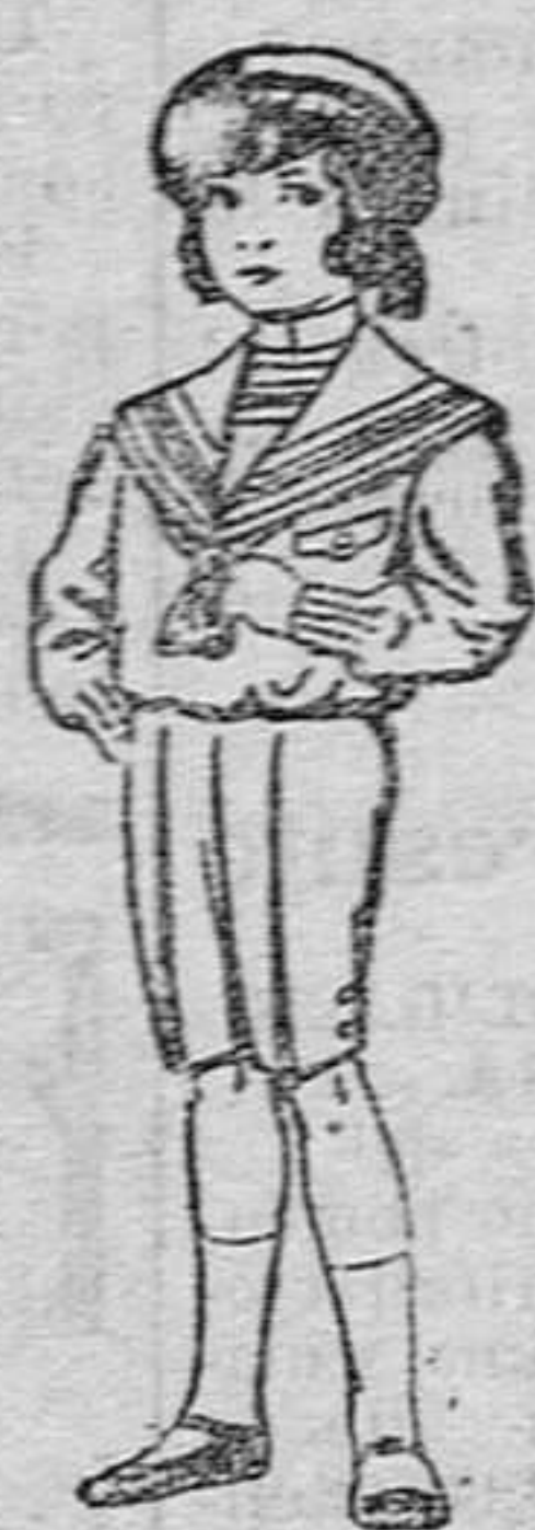
Trajes de vicuña ó jerga, negros y azules, para niños de 4 á 9 años ptas. 6 á 51

Madrid, Barcelona, Alicante, Almería, Bilbao, Cádiz, Cartagena, Gijón, Granada, Málaga, Palma de Mallorca, Sevilla, Valencia, Valladolid y Zaragoza.