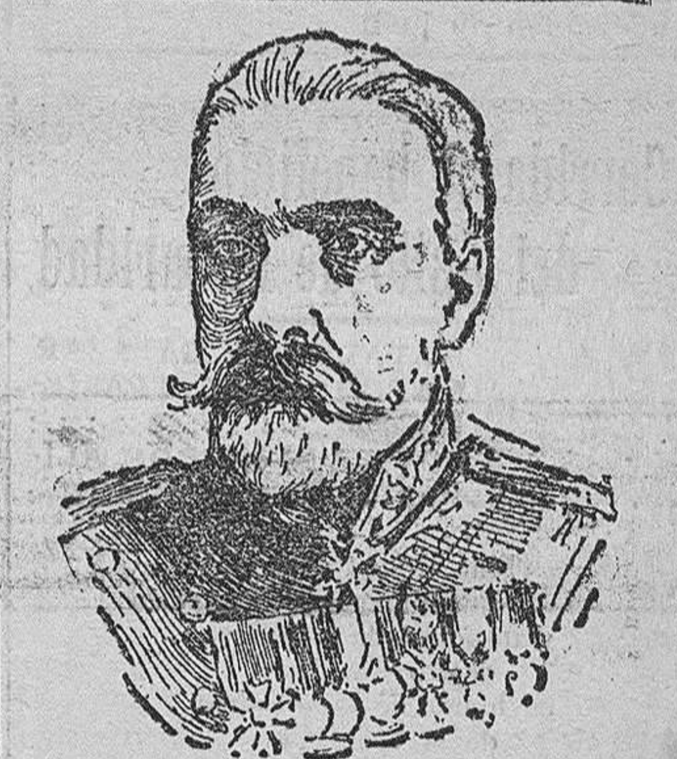
ALMIRANTE GOIGOROWITCH ministro de Marina del Imperio ruso.

A poco que se acentúe esta severidad, los chicos se acostumbrarán á circular sólo por las calles donde no haya tantos peligros, y por lo menos, se conseguirá que disminuya en la ciudad el número de accidentes causados por los vehiculos.