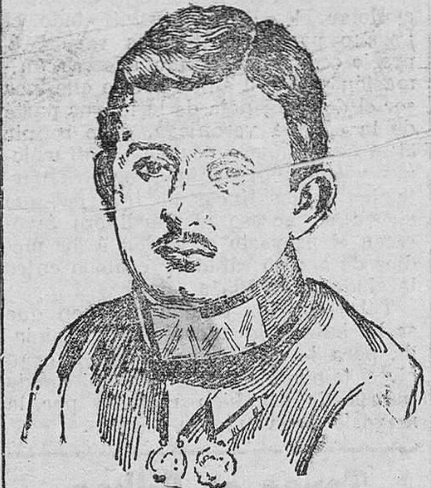
CARLOS FRANCISCO JOSÉ archiduque heredero de Austria-Hungria generalísimo de los ejércitos austro-húngaros.

El 16 cuerpo de ejército austriaco atacó la frontera occidental de Montenegro, y el 15 cuerpo marcha sobre Chaimis y Gaskó.