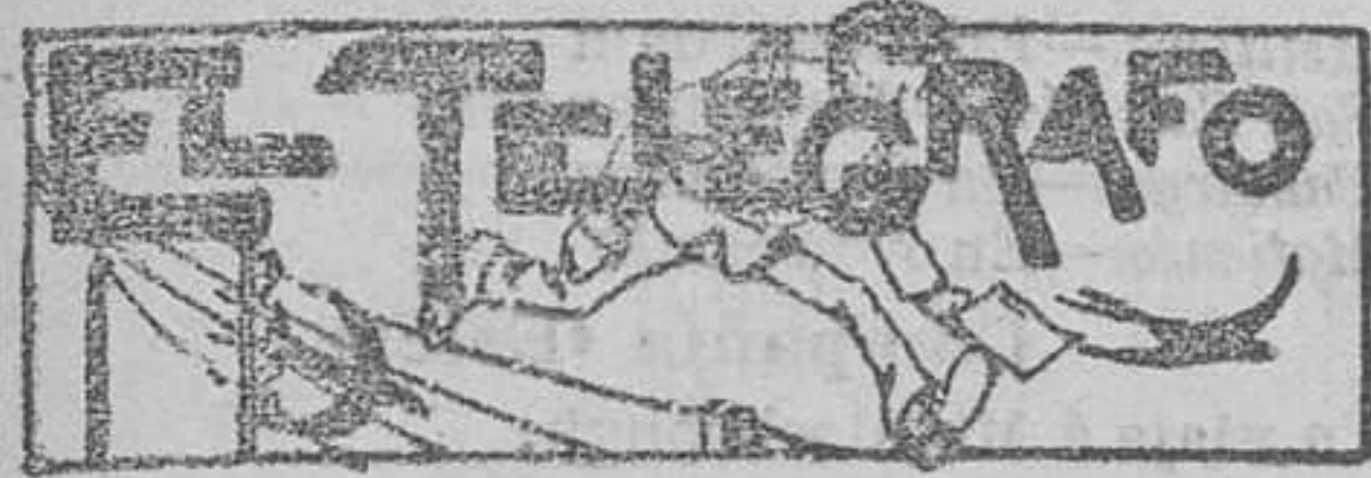
(Conferencia telegráfica de la madrugada)

Las operaciones verificadas en el día de hoy por los Corredores del Colegio de esta plaza. Accion «Minas de Heras» a 77 por 100, (pesetas 8.000). Santander 2 de octubre de 1905.—El adjunto de turno, Manuel Orbe.