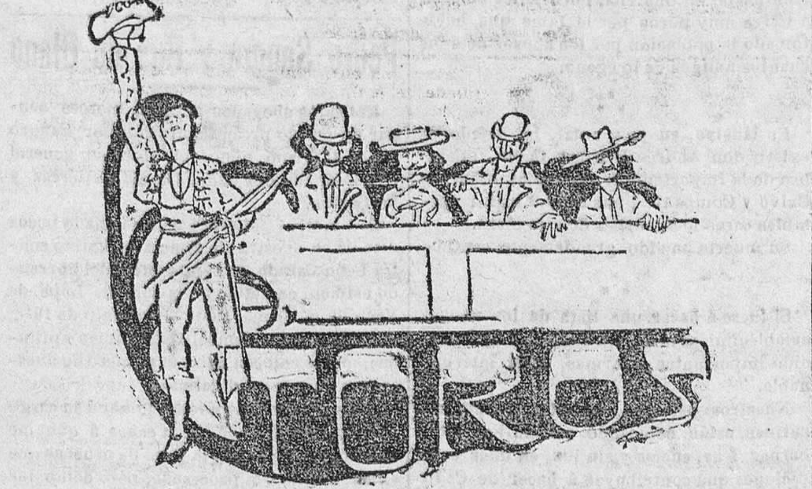
La tercera de Ferias