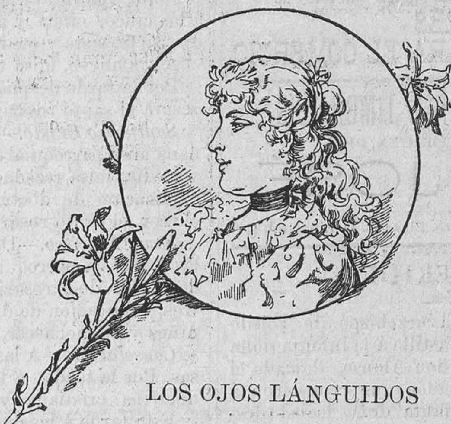
LOS OJOS LÁNGUIDOS

En el tren va al Sardinero esa de los ojos lánguidos y en las playas y en los árboles