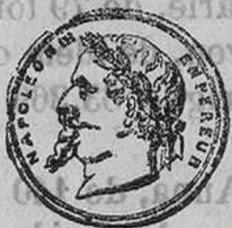
GRAN MEDALLA DE HONOR.