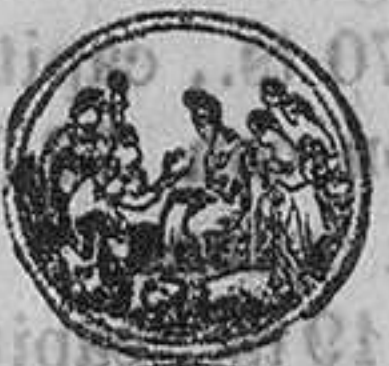
EXPOSICION INTERNACIONAL DE LONDRES.