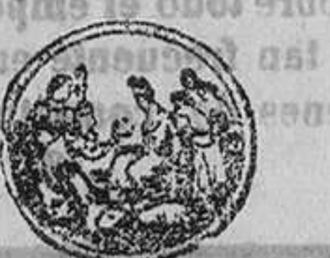
EXPOSICION INTERNACIONAL DE BRONCE DE 1862 CAUSA