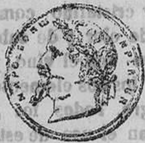
GRAN MEDALLA DE HONOR.