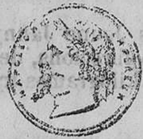
GRAN MEDALLA DE HONOR

Los que se abren en la edición de lujo por un año recibirán gratis el magnífico Almanaque Enciclopédico Español Ilustrado que esta empresa publica anualmente solo con este objeto. Administraciones principales.—Madrid: librería de D. Carlos Bailly Baillière, plaza del Príncipe Alfonso, 8.—Cádiz: Administración de La Moda, calle Ahumada, 5.—Se suscribe en Santander, librería de Fabian Hernandez.