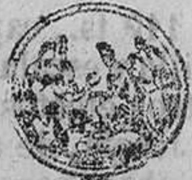
EXPOSICION INTERNACIONAL DE LONDRES