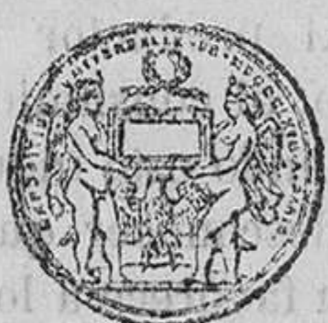
CONDECORADO POR S. M. LA REINA DE ESPAÑA CON LA