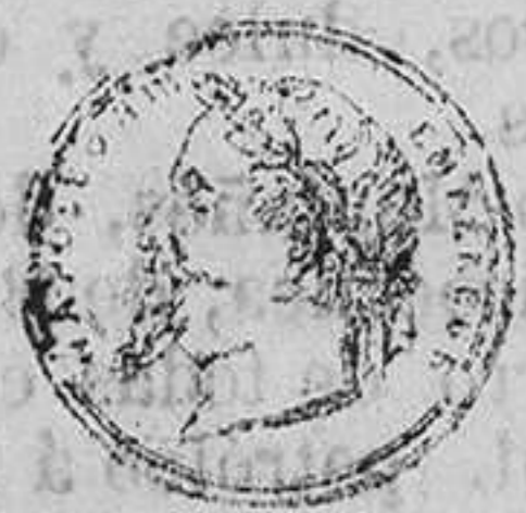
MEALLA DE HONOR

IMPRENTA DE LA ABEJA MONTAÑESA, á cargo de D. Salvador Atienza, calle de la Compañía, núm. 5, cuarto bajo.