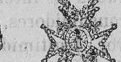
CRUZ DE LA REAL Y DISTINGUIDA ORDEN DE CARLOS III