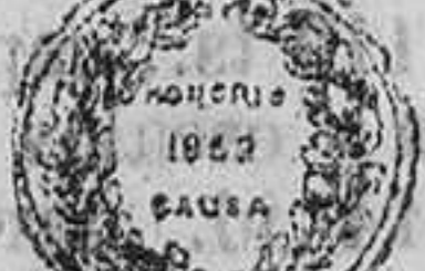
EXPOSICION INTERNACIONAL DE LONDRES