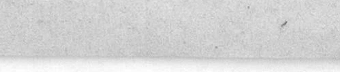
BUICK. Sedán siete plazas. Maxter Six

Observe Vd. en carretera el magnífico rendimiento de los innumerables coches BUICK que hallará en el camino. Obse ve también en la ciudad la suprema elegancia y refinado confort de esta célebre marca. Estas observaciones le decidirán a visitar nuestro salón exposición y cuando haya apreciado las cualidades de su soberbio motor de seis cilindros y válvulas sobre la culata montado sobre el famoso chasis blindado BUICK, cuando haya estudiado las ventajas de sus potentes frenos a las cuatro ruedas, suavidad de marcha y económico entretenimiento, su resolución será inmediata y el BUICK tendrá en usted un nuevo y entusiasta admirador.