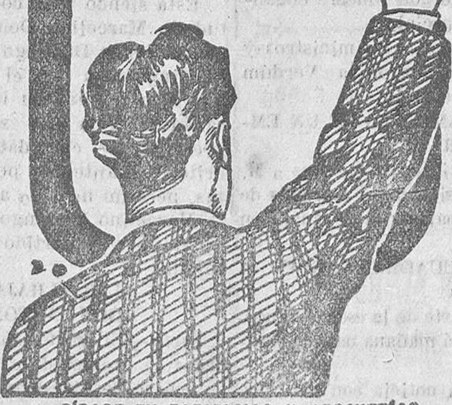
PREPARADO EN FARMACIAS Y DROGUERIAS

y los Médicos le llaman el REMEDIO DE LOS DÉBILES