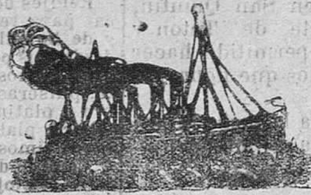
Vapores correos españoles

El remedio para las ENFERMEDADES DEL PECHO más eficaz las TOS más recientes y ANTICUAS para otros: las BRONQUITIS CRÓNICAS