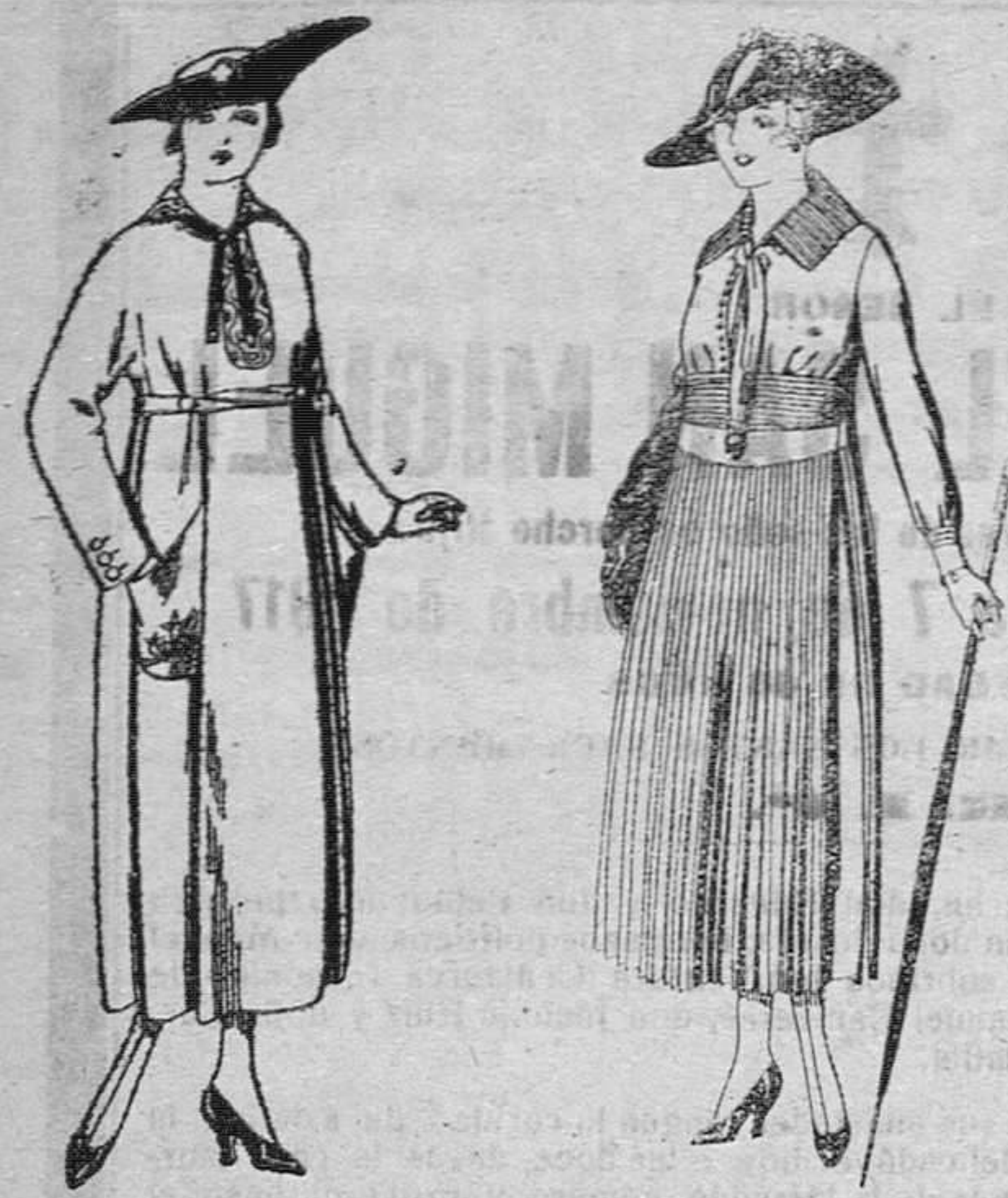
Vestidos de gabardina, cetambres etc. en color azul, bordados.—De pts. 53 a 80. Los mismos, en punto de lana «Jers», bordado.—De pesetas 93 a 112.