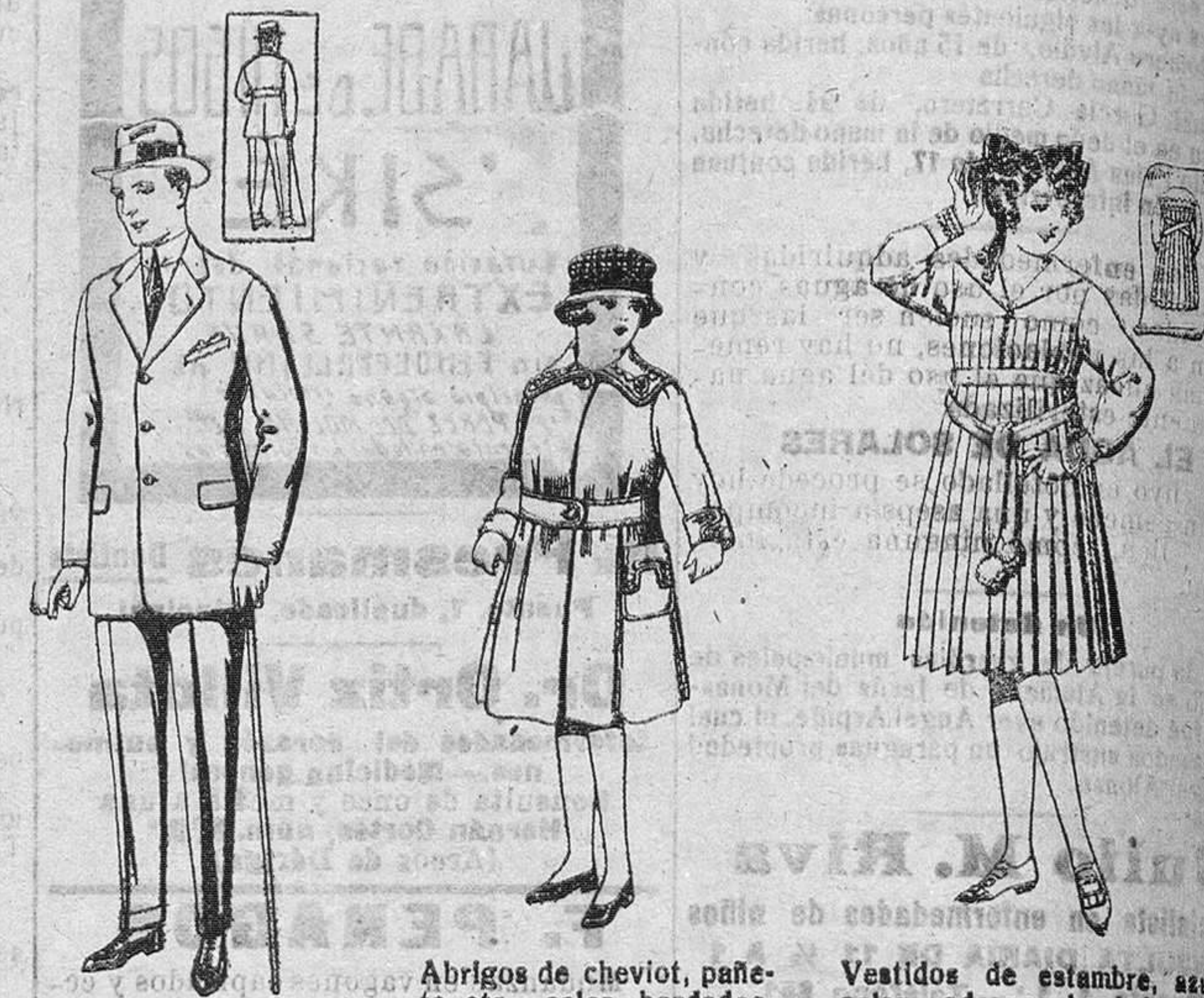
Trajes de cheviot, corte elegante, para sportman.—De pesetas 45 a 57.