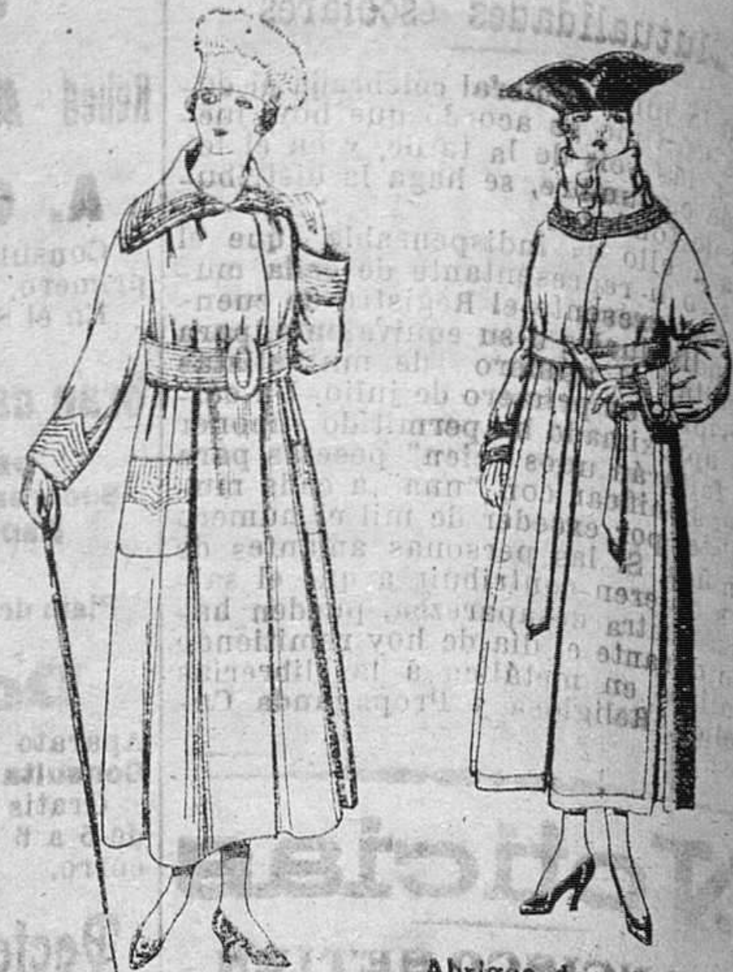
Abrigos de cheviot, gamuzas, etc.—De pts. 50 a 60.