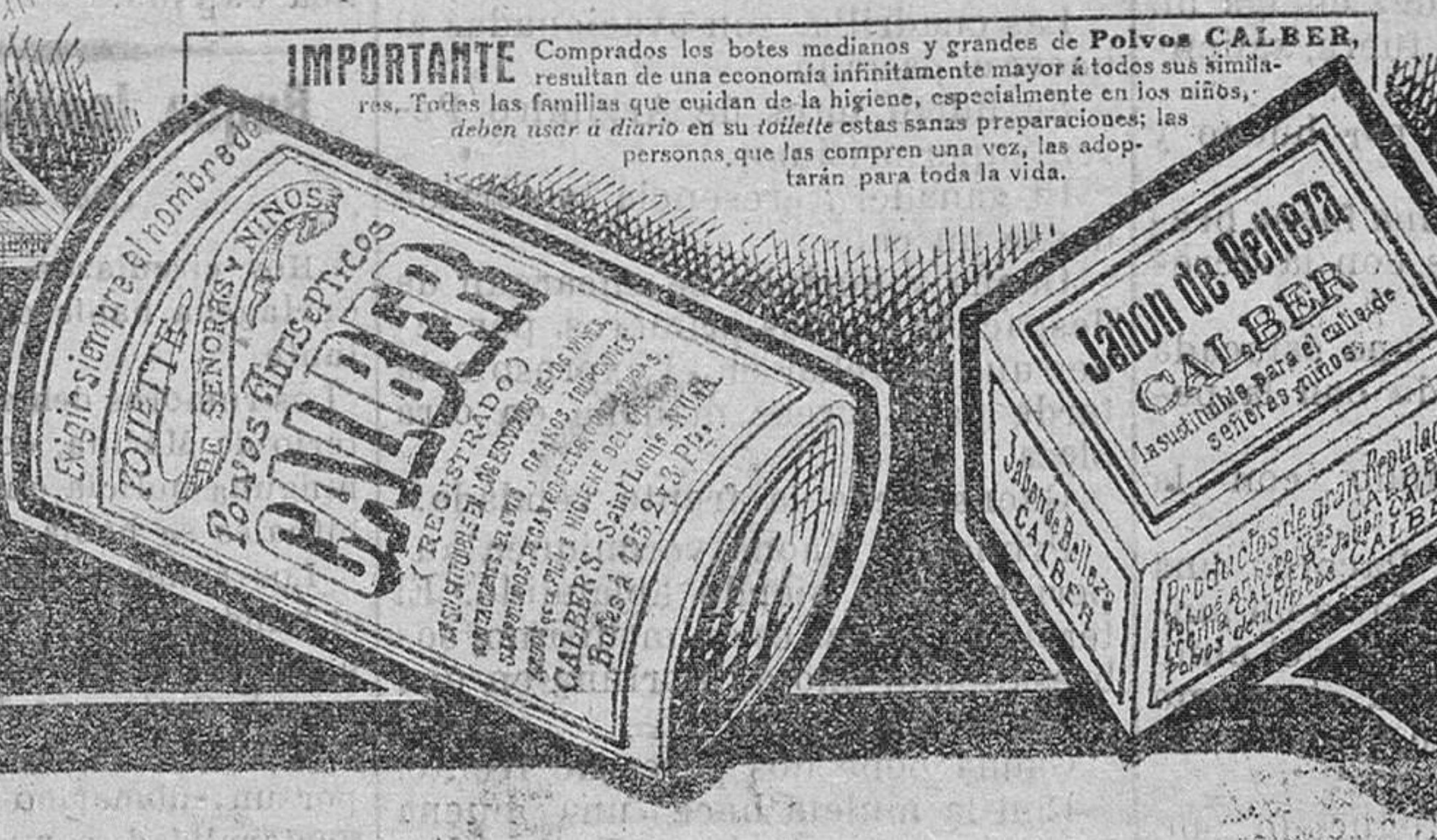
Se venden en Santander: señores Pérez del Molino y Compañía y señores Villaverde y Calvo

son los preferidos por todas las madres y señoras cuidadosas de la higiene y de la salud. Y su reputación es tan sólida, porque son distintos de los demás, é infinitamente mejores, para los escocidos de los niños especialmente, irritaciones de la piel, granos, sarpullidos, rojeces, erupciones, manchas del cutis é higiene en general del cuerpo. La comodidad de su envase especial evita el uso antihigiénico de la bolsa ó algodón.