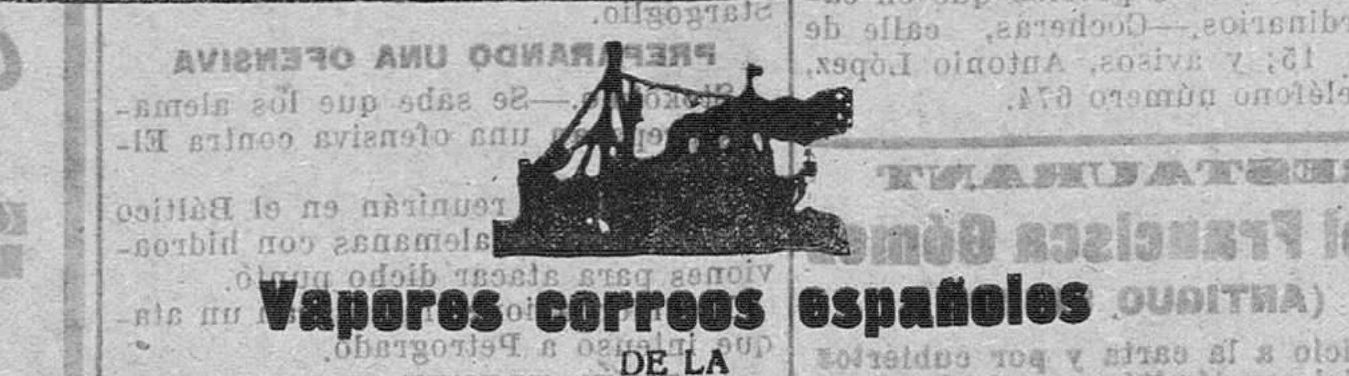
Vapores correos españoles DE LA