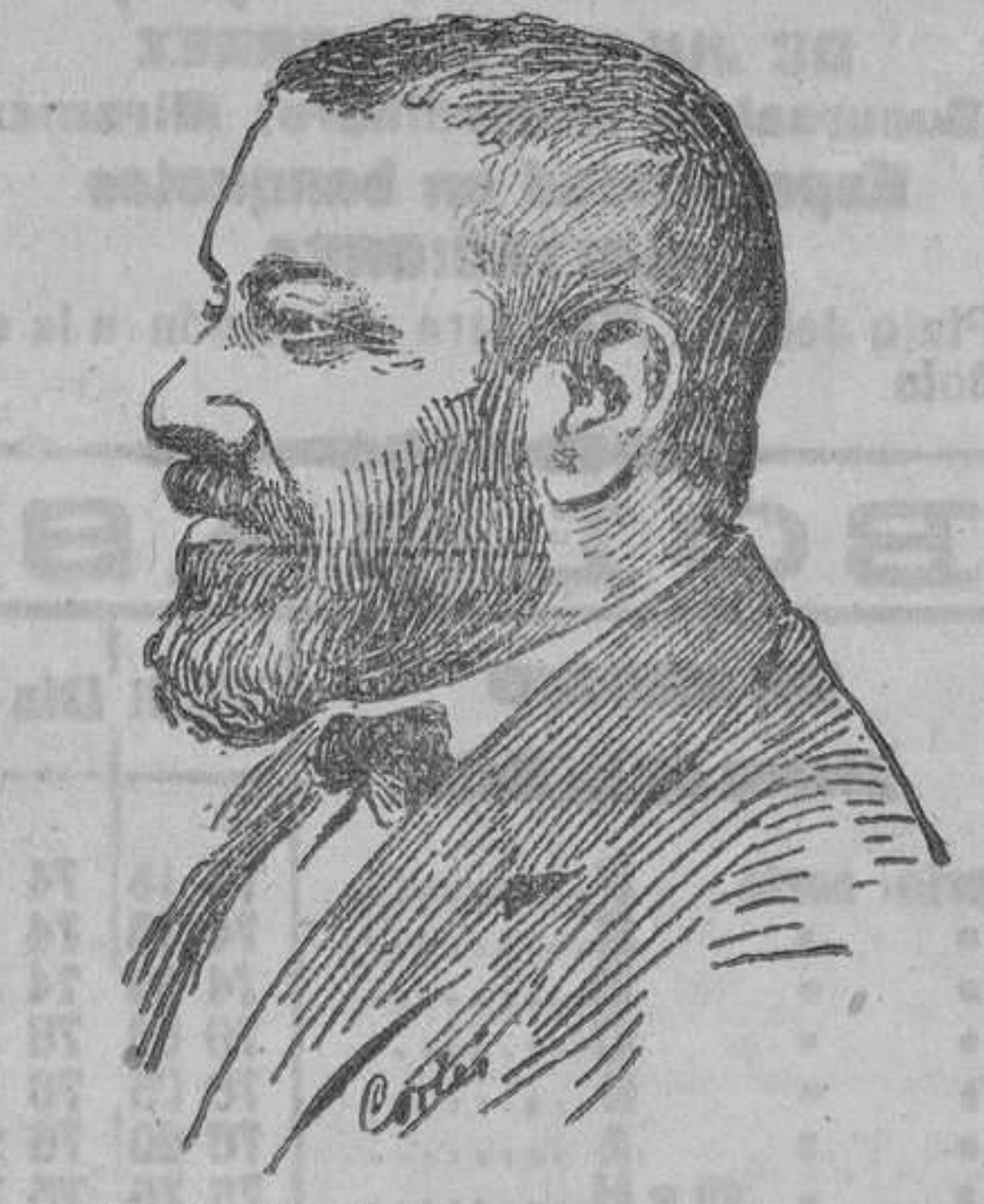
General Aguilera nuevo ministro de la Guerra.