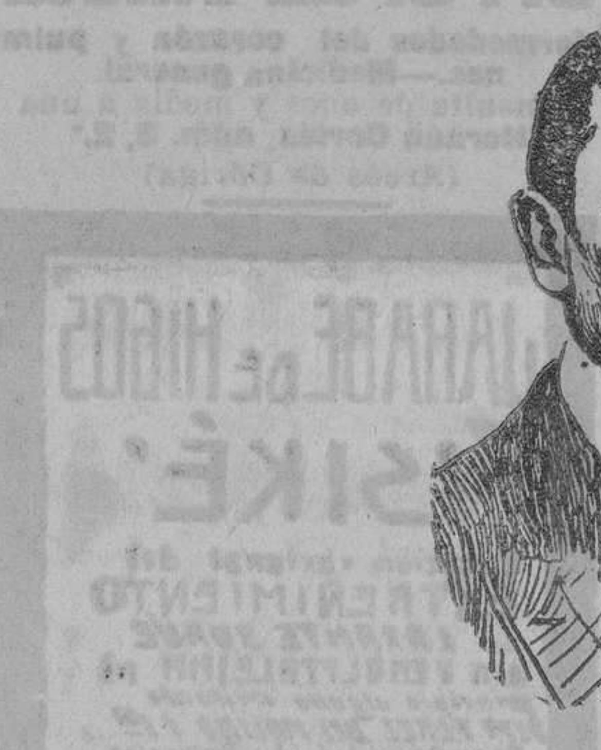
Señor marqués de Alhucemas presidente del nuevo Consejo de ministros.