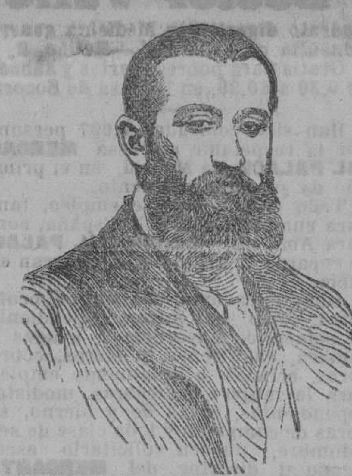
Duque de Almodóvar del Valle nuevo ministro de Fomento.

El "Alfonso XII" El día 16 último salió de Habana con rumbo a Santander el vapor correo "Alfonso XII", que conduce para este puerto 108 pasajeros y 15 toneladas de carga. Se espera su llegada del 28 al 29 del corriente. El "Hernán Cortés" Por noticias particulares sabemos que ayer, a la una de la tarde, salió de Santoña el cañonero "Hernán Cortés", que lleva a remolque la mina submarina que apareció en Bermeo.