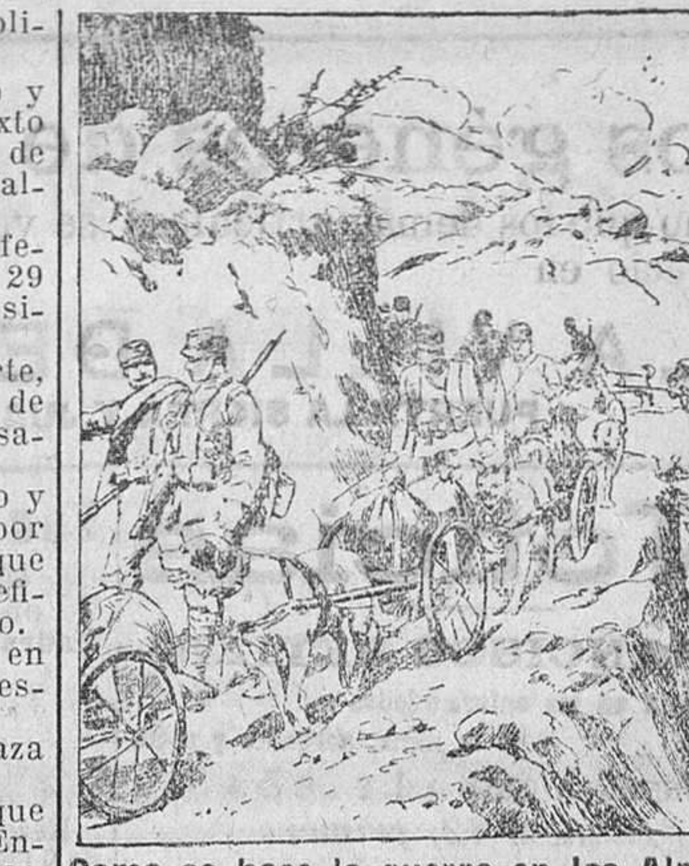
Como se hace la guerra en los Alpes. Columna austríaca de aprovisionamiento conduciendo agua a las posiciones avanzadas del Tintino.