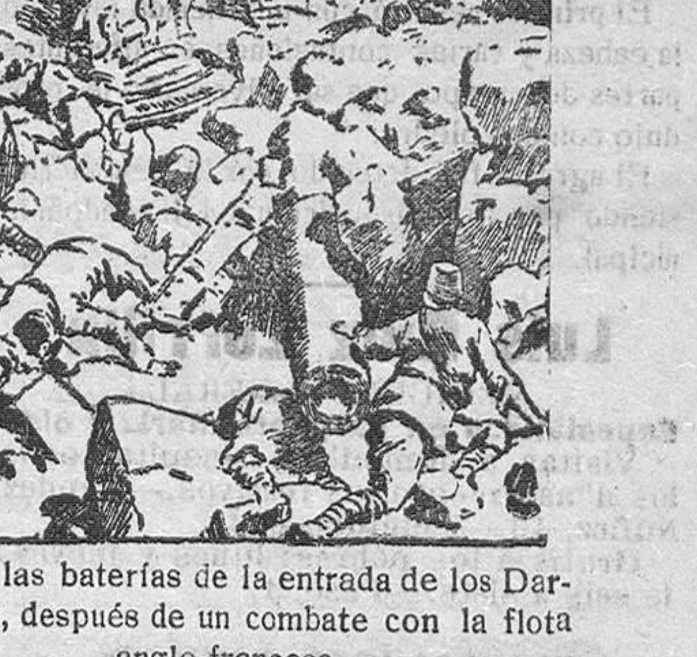
Una de las baterías de la entrada de los Dardanelos, después de un combate con la flota anglo-francesa