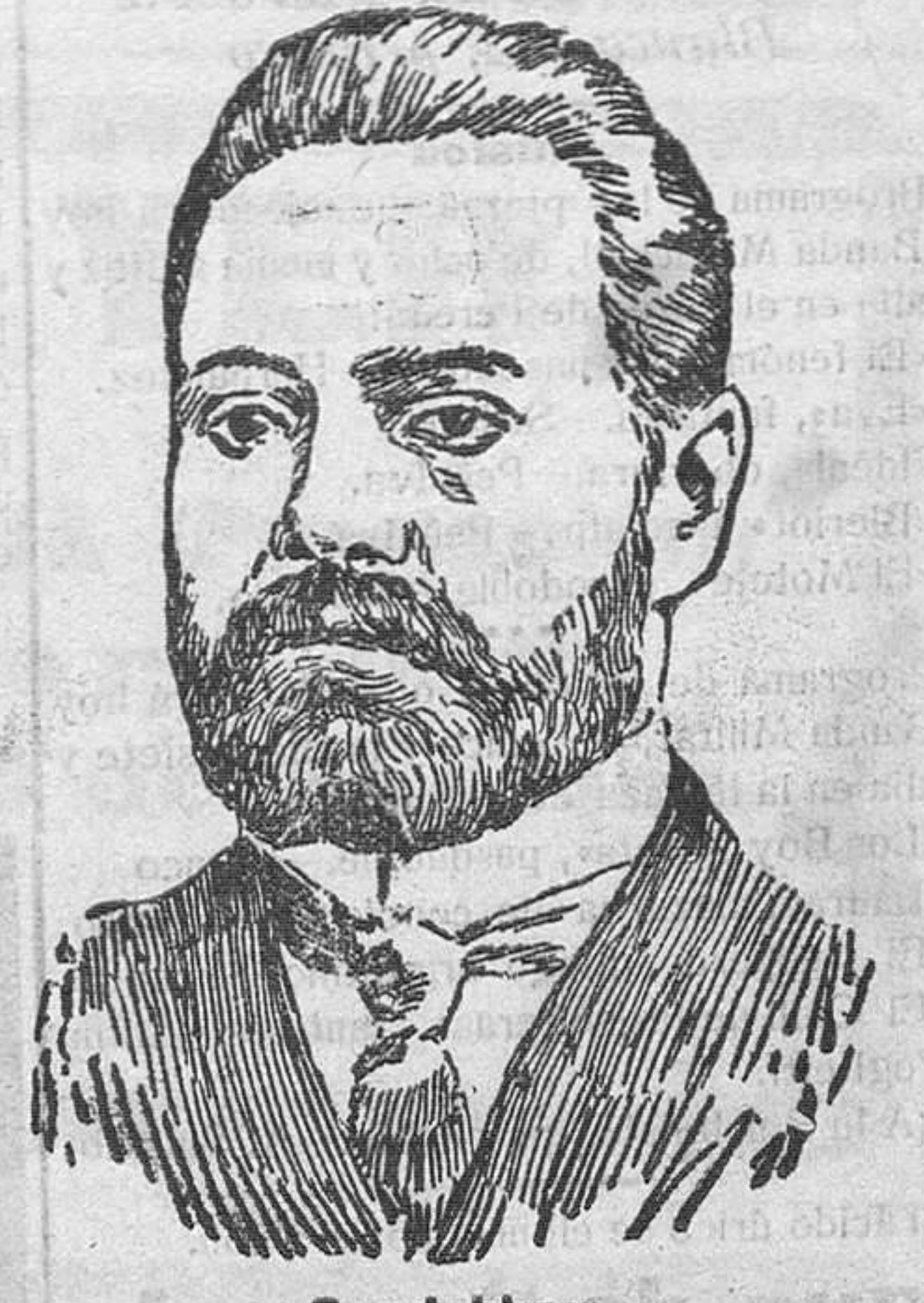
Gondchkow, ministro de Municiones de Rusia.

Por las víctimas del "Peña Castillo" Suma anterior... 1.216,20 Don G. C. .... 50,00 Total..... 1.266,20