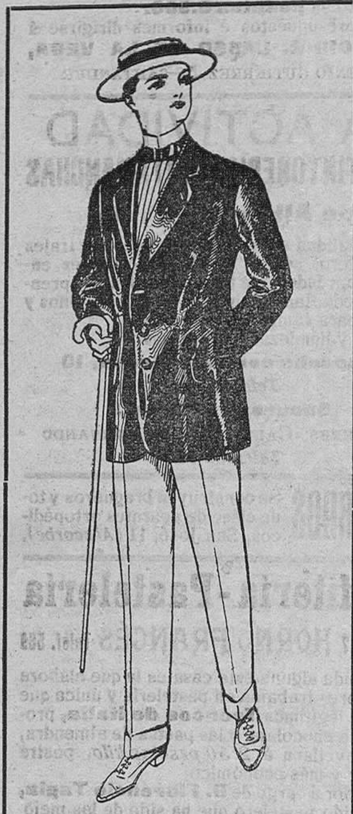
Traje de alpaca negra DE PTAS. 32 Á 56 Pantalones de dril blanco Á PTAS. 6'50

Secciones de Camisería, Género de punto, Corbatería, Guantería, Sombrerería, Zapatería, Paraguas, Bastones, Sombrillas, Artículos para viaje