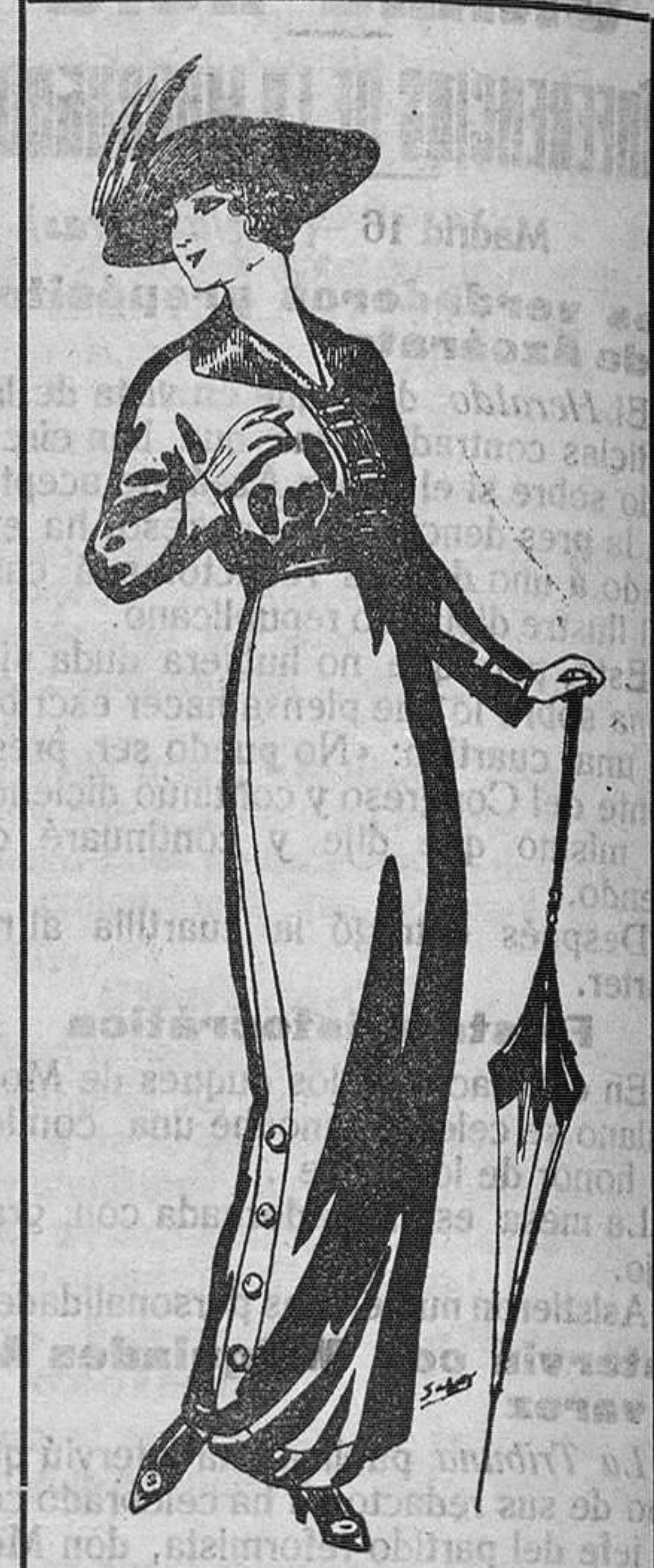
Vestido de lana negra PARA SEÑORA Á PTAS. 22

PRECIO FIJO Pídase el catálogo general VENTAS AL CONTADO