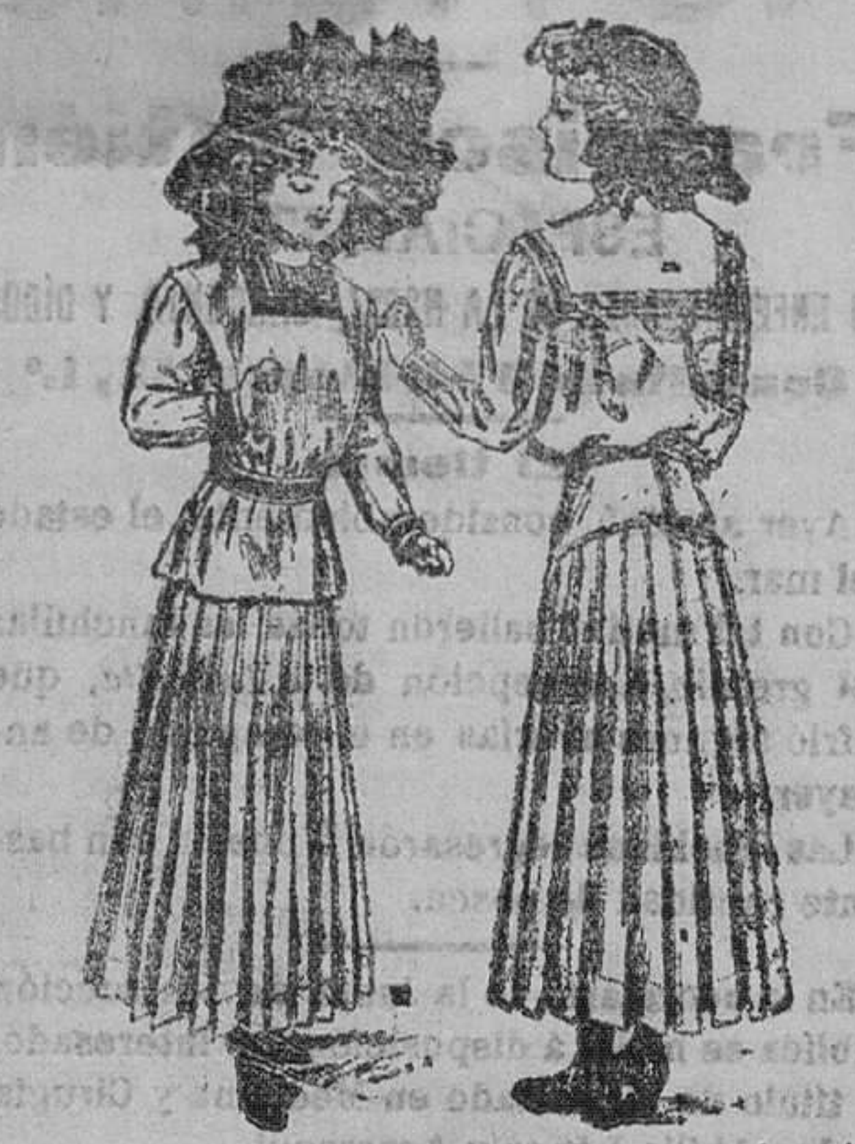
Ved este modelo, que puede ser confeccionado con paño Panamá, una serga de seda, u otro tejido propio de la estación en que se ha de usar la falda.

Porque estos pataches, reminiscencias de una navegación pretérita, tienen la noble traza de galeones victoriosos.