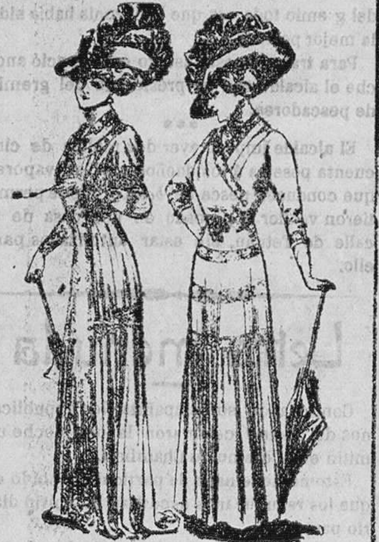
Ved aquí un velo Ninon heliotropo estampado con gruesas pastillas blancas.

Sobre el traje primorosa, se plegan como dos chales de tul ojaleado del mismo tono, cuyas puntas caen p delante y detrás sobre el vestido bordado. La draperie remonta hasta la mitad del corpiño.