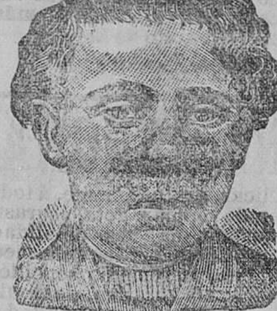
Antes de la curación.

Descubrimiento sensacional. Curación de las enfermedades de la piel y también de las llagas de las piernas.