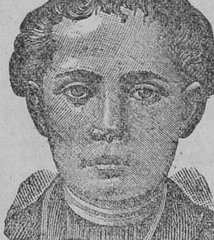
Después de 15 días de tratamiento.