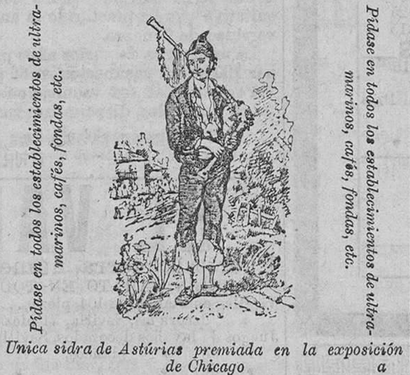
Única sidra de Asturias premiada en la exposición de Chicago

SIDRA CHAMPAGNE DE VALLE, BALLINA Y FERNANDEZ VILLAVICIO (ASTURIAS)