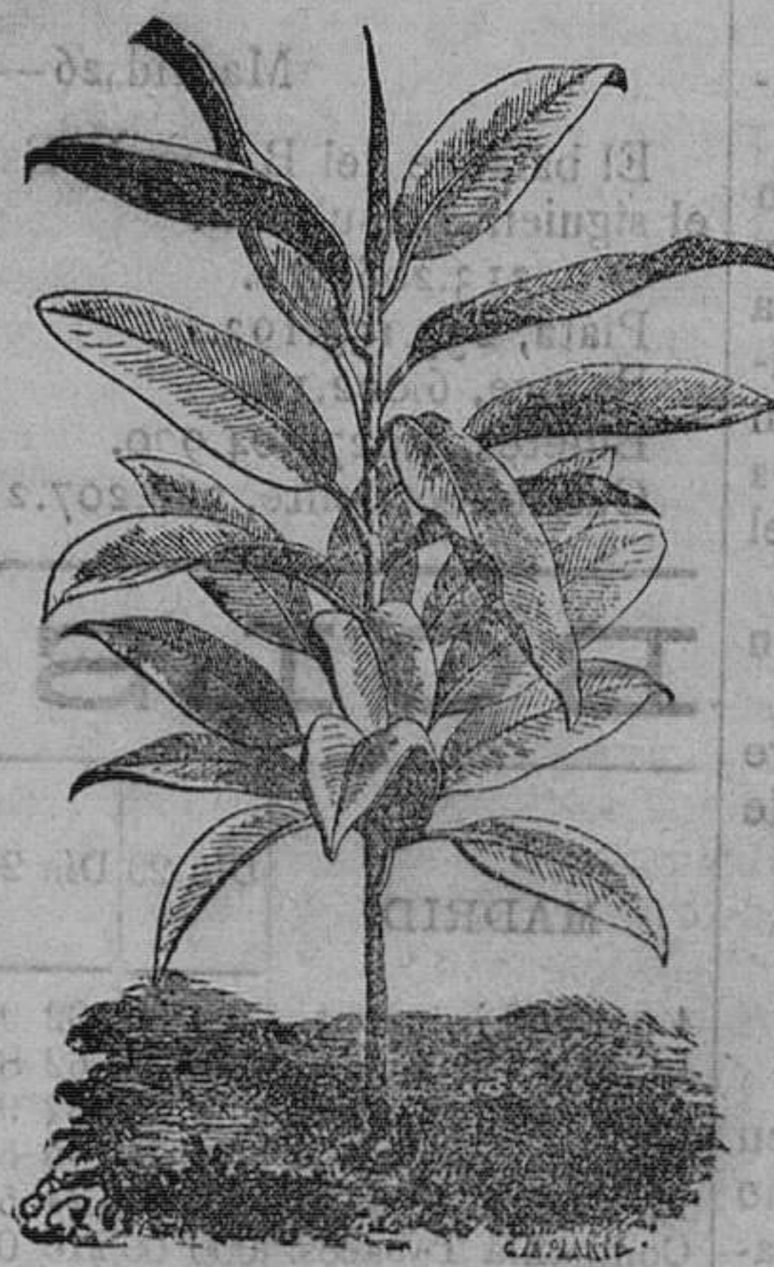
Ficus elástica caucha.—Elegantes plantas para salones.—De 3 á 10 pesetas una.