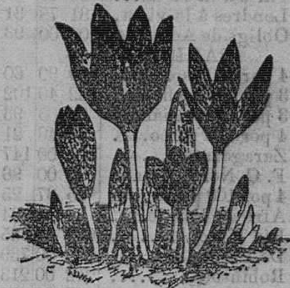
Colobacion color de rosa.—Vivara, flores dentro de un papel. Pieza, 1 peseta; docena, 7 pesetas.

Vende cuarenta mil vegetales de 200 variedades de árboles frutales, alta novedad.—100 variedades de árboles de sombra y maderables.—400 variedades de arbustos de adorno y floríferos.—600 variedades de cebollas y tubérculos en flor.—200 variedades de plantas en tiestos para conasillas y salones, trazados y plantaciones de parques y jardines, á precios módicos.—Hermes catálogos gratis á quien los pida.