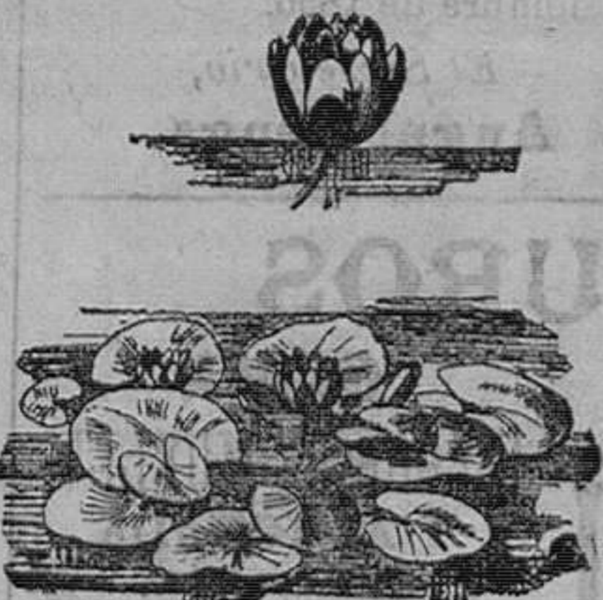
Ninfea de flor blanca pura, planta acuática.—Pieza, 1 peseta 25 céntimos; la docena, 10 pesetas.