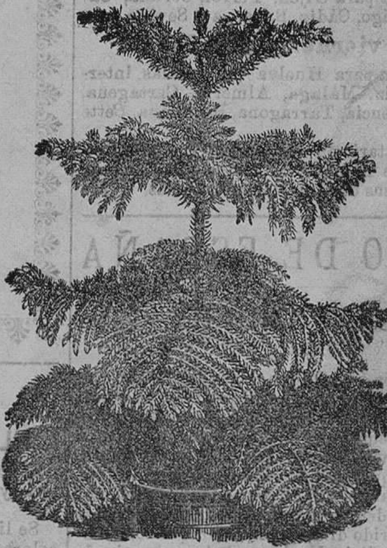
Arancaria excelss.—Bellas plantas para salones y demás.—Pieza, de 6 á 10 pesetas.

Jardinero del Instituto de esta capital, calle de Magallanes, número 36, Santander. Catálogo de cebollas y tubérculos de flores, gratis á quien los pida.