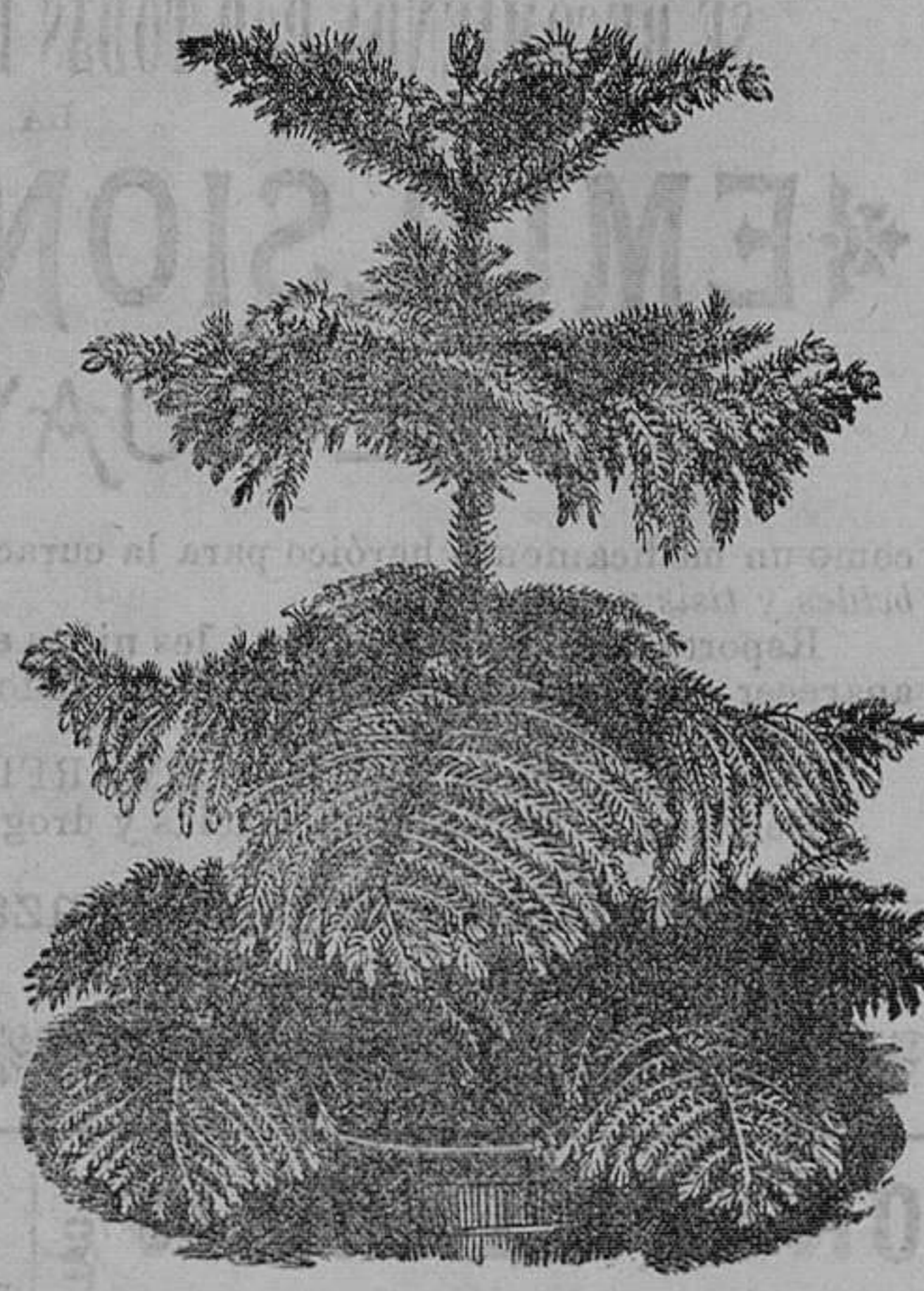
Arancaria excelsa.-Bellas plantas para salones y demás.-Pieza, de 6 a 10 pesetas.

Jardinero del Instituto de esta capital, calle de Magallanes, número 36, Santander. Catálogo de cebollas y tubérculos de flores, gratis a quien los pida.