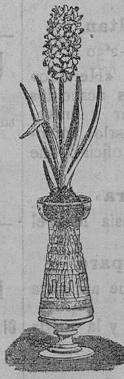
Jacintos variados dobles para agua. Pieza, 1 peseta. Idem con botella bonita modelo, 4 pesetas pieza.