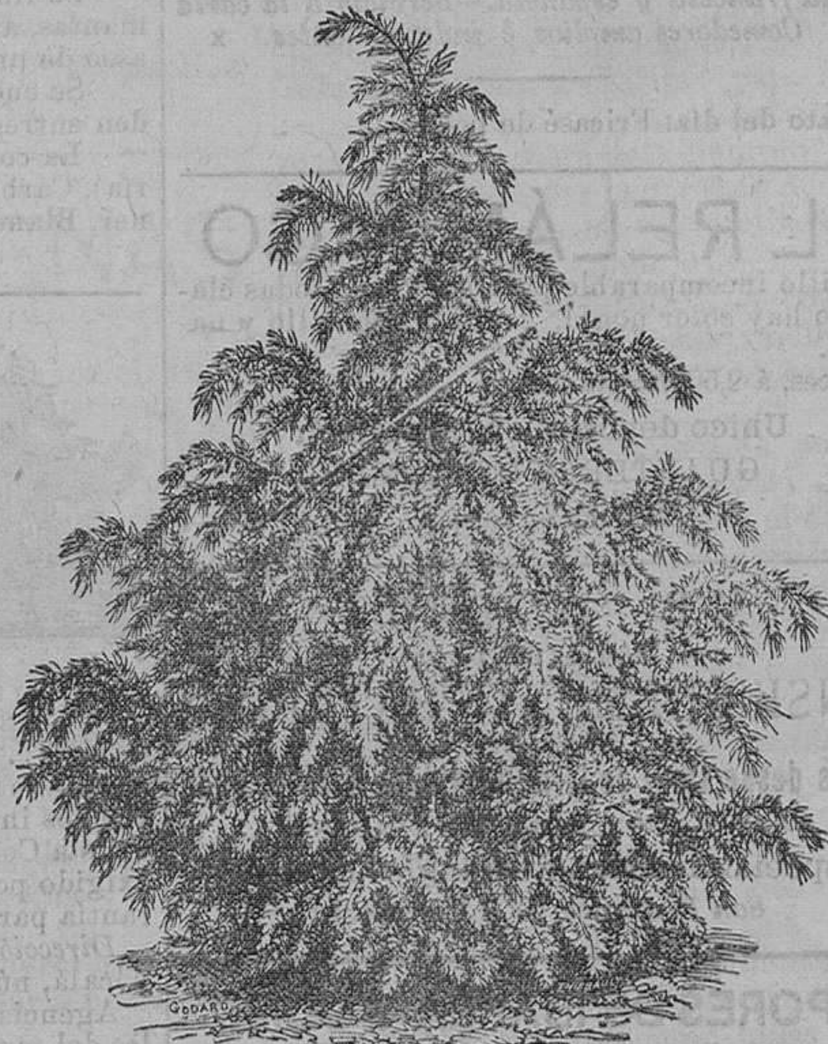
Cedro de Odra. Robusta: pieza, de 1 peseta á 10 pesetas. Idem de Libano: pieza, de 150 pesetas á 10 pesetas.

Vende cuarenta mil vegetales de 200 variedades de árboles frutales, alta novedad.—100 variedades de árboles de sombra y maderables.—400 variedades de arbustos de adorno y floríferos.—600 variedades de cebollas y tubérculos en flor.—200 variedades de plantas en tientos para canastillas y salones, trazados y plantaciones de parques y jardines, á precios módicos.—Remite catálogos gratis á quien los pida.