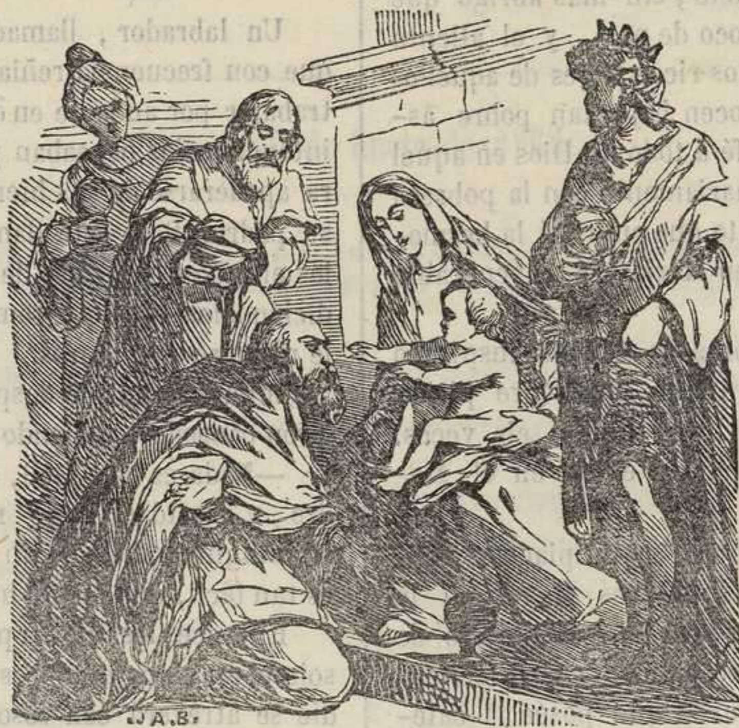
Adoracion de los Reyes.

La festividad que la Iglesia cristiana celebra en conmemoracion de este acontecimiento, se llama generalmente Epifanía ; palabra griega que significa aparicion ó manifestacion, por haber sido aquella la primera ocasion en que el Salvador se dió á conocer á los gentiles. Varios escritores la designan con los nombres griegos tambien Theofania y Theopsia , cuyas significaciones son análogas á la primera; pero llámase vulgarmente la Adoracion de los Reyes , por la comun creencia de que estaban revestidos de la real dignidad los Sábios ó Magos que fueron á adorar á Jesucristo: sobre este punto los libros sagrados no dan mayores esplicaciones. Nada nos dicen acerca del número de aquellos misteriosos adoradores del Dios niño, ni sobre sus nombres, ni pais de donde vinieran. La tradicion hebráica los llama Magalat , Galgalat y Sarachim , y la latina, Melchor, Gaspar y Baltasar, habiendo sentado varios autores, aunque sin pruebas suficientes, que uno de ellos era de Tarso, otro de Saba, y el restante de Nubia.