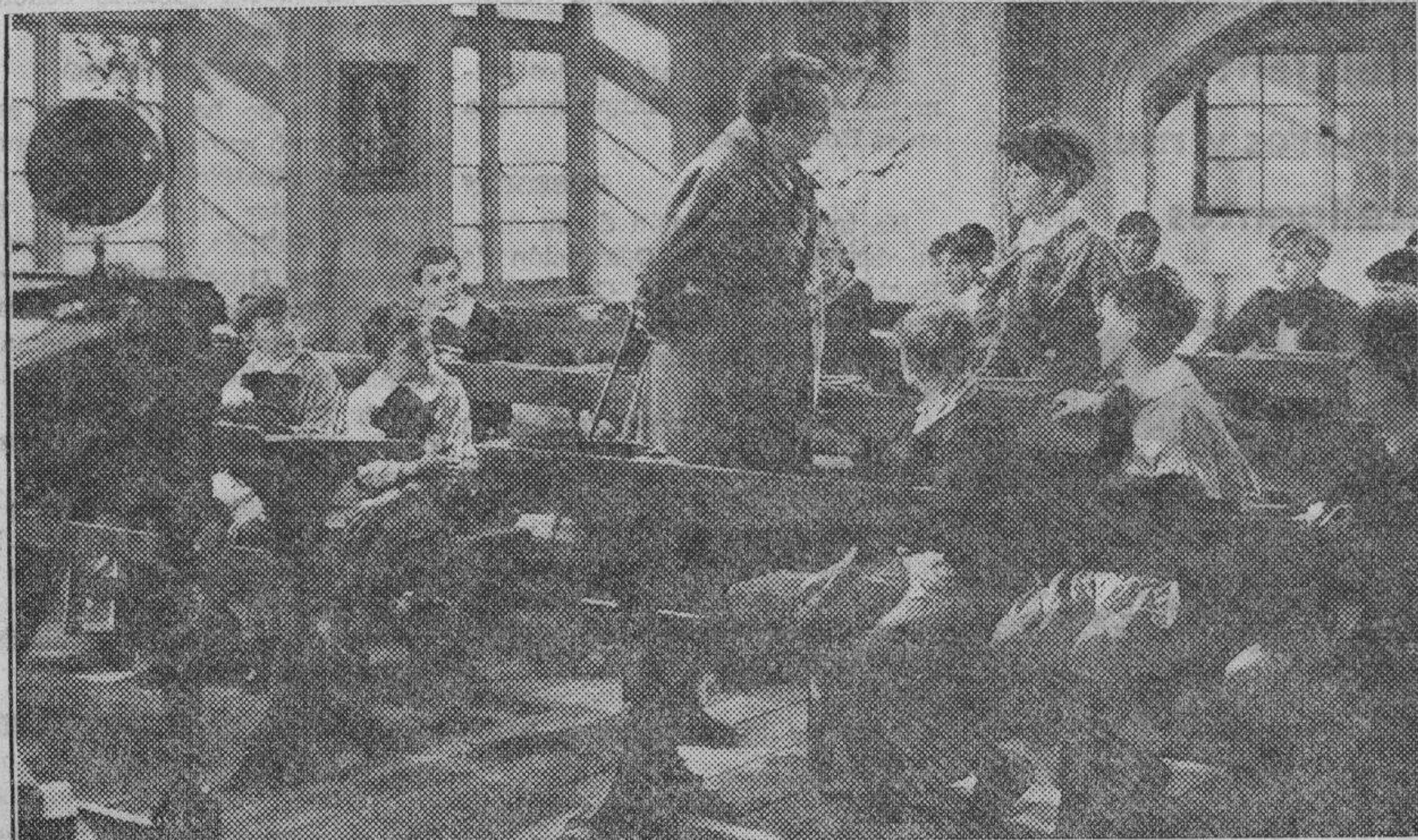
Una de las bellísimas escenas de la extraordinaria producción musical de la marca British International Picture AL LLEGAR LA PRIMAVERA, que presenta la prestigiosa entidad valenciana CIFESA

Hay que prevenir para evitar que se nos eche encima el conflicto sin preparación de la menor clase, por que nada eximiría entonces de responsabilidad a los más obligados a anticiparse en esta urgente atención porque no hay que ocultar, engañándose y engañando, que se aproximan días en Castellón y fuera de Castellón de una grave crisis de trabajo, más grave aquí que en parte alguna por lo mismo que no son corrientes en esta comarca tales estados de cosas, por la abundancia natural, pareja con la frugalidad de nuestra gente.