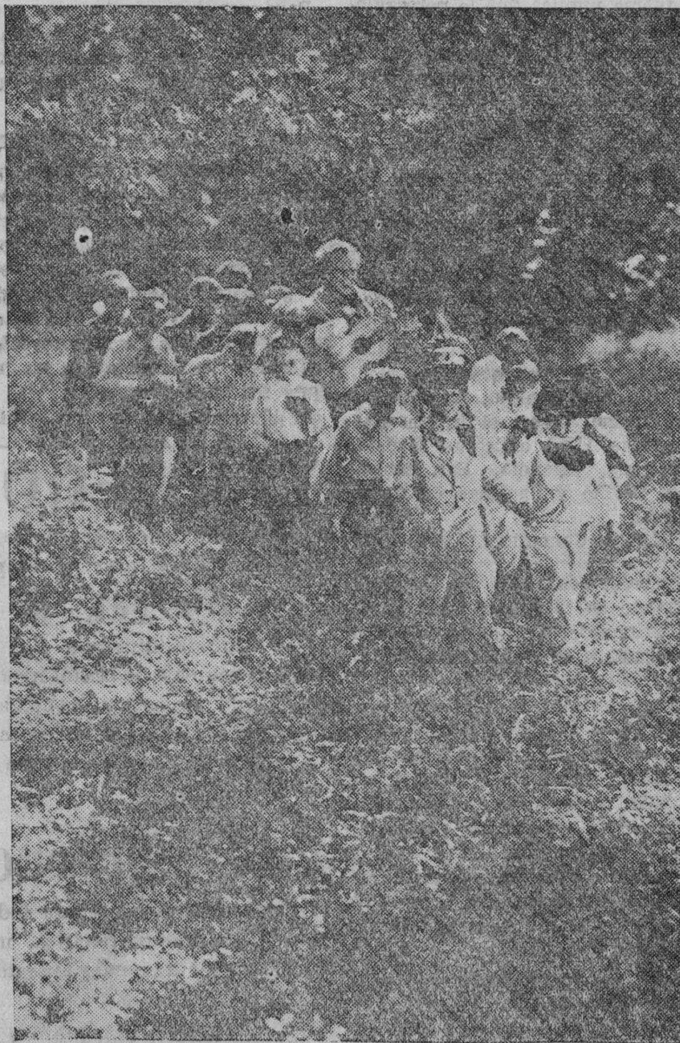
Uno de los más bellos momentos del film musical de la British International Pictures AL LLEGAR LA PRIMAVERA que distribuye CIPESA