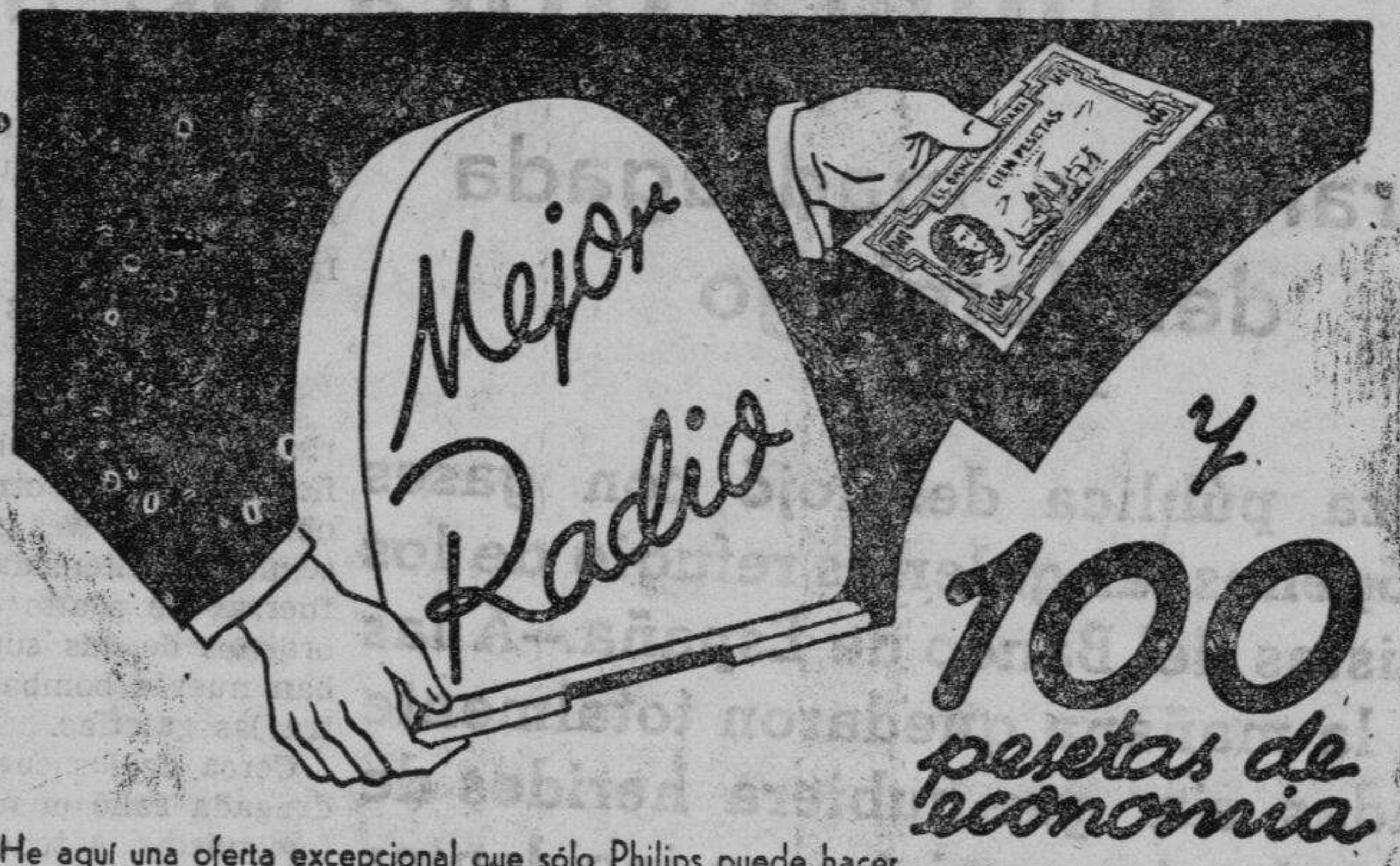
He aquí una oferta excepcional que sólo Philips puede hacer.

En general la actuación del domingo de los corredores españoles está siendo elogiadísima.