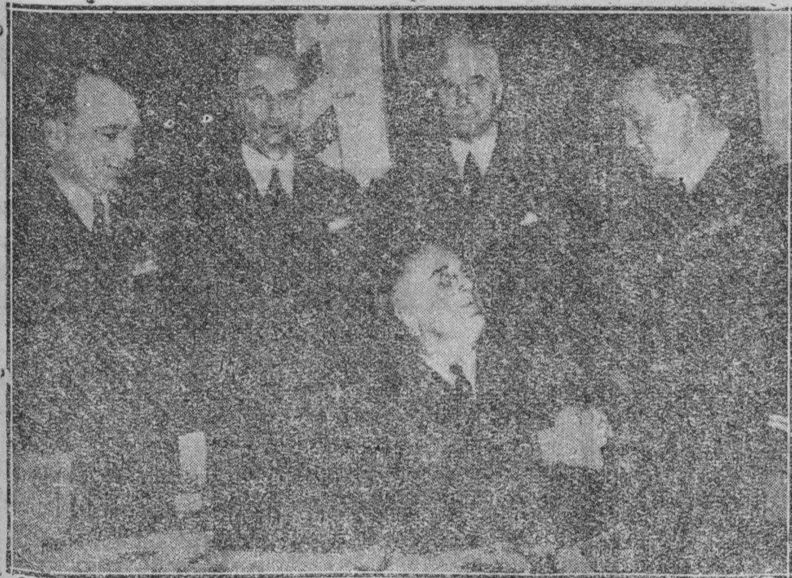
Recepción de los aviadores Codos y Rossi en la Casa Blanca. El Presidente de la República de los Estados Unidos, sentado, estrecha la mano de Codos. De pie a izquierda a derecha, Rossi, M. de Laboulaye, embajador de Francia en Washington, Cordell Hull, Codos.

PRIMERA TELEFOTOGRAFIA DE LA RECEPCION DE CODOV Y ROSSI POR EL PRESIDENTE ROOSEVELT