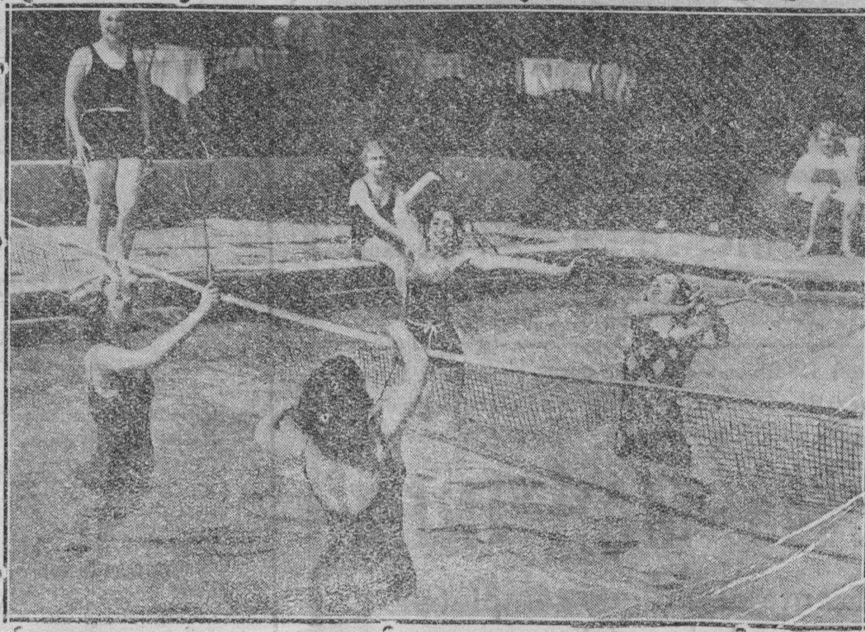
El último campeonato, ha sido ganado por el equipo del Fintridge Girls School. El juego se desarrolla en una piscina de medio fondo y como se ve por la foto tiene cierta semejanza con el tenis.

BONITAS MUCHACHAS DE LA SOCIEDAD PASADENA (CALIFORNIA), PRACTICANDO UN NUEVO DEPORTE ACUATICO