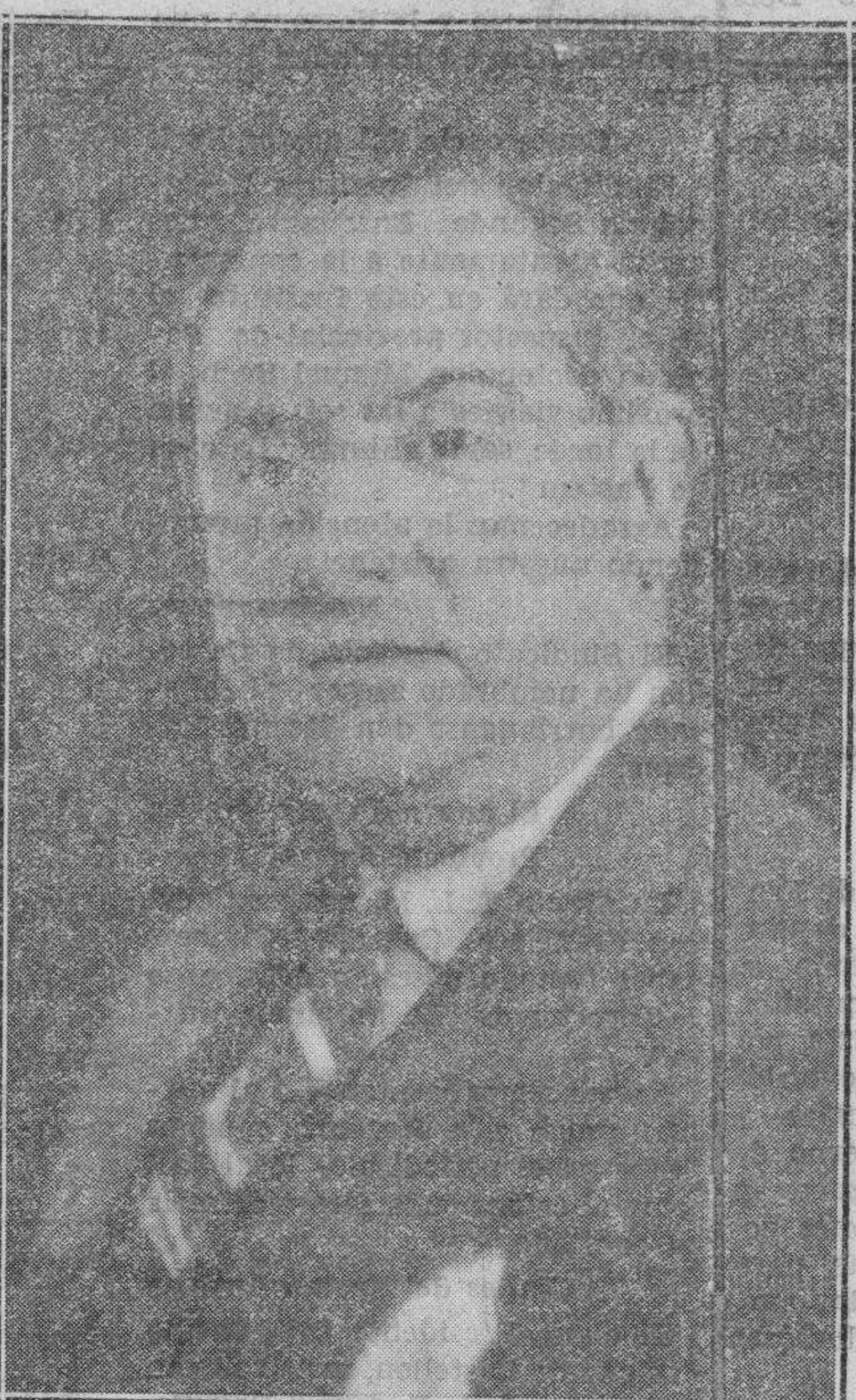
El Exmo. señor don Vicente Sales Musoles, ministro plenipotenciario de España en Río Janeiro (Brasil)

No nos sorprende: a los que conocemos y estimamos las relevantes prendas personales que atesora su laboriosidad infatigable, sus preclaros talentos, su admirable don de gentes, su profundo conocimiento de los problemas mundiales, sus arraigadas convicciones altruistas, la fineza de su trato, la delicadeza de sus sentimientos y, sobre todo, la exquisita diplomacia con que sabe sortear los más peligrosos conflictos y las más áridas cuestiones: todo esto envuelto en el ténue velo de una modestia excesiva y de una bondad acrisolada, no, no podía sorprendernos la designación del Gobierno al confiarle los altísimos intereses del Estado español en una República tan floreciente y aristocrática, como la del Brasil, emporio de paz y riqueza entre todos los Estados sudamericanos. Y como el honor de los pueblos va siempre vinculado al honor de sus hijos, gloríase la ciudad de Burriana en el honor que le cabe de poder dar a la publicidad datos biográficos de uno de sus más ilustres hijos el Excelentísimo señor don Vicente Sales Musoles.